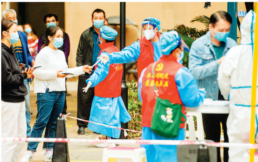
11月10日,江北区石马河街道可乐小镇小区,党员志愿者在核酸采样点引导居民有序排队采样。