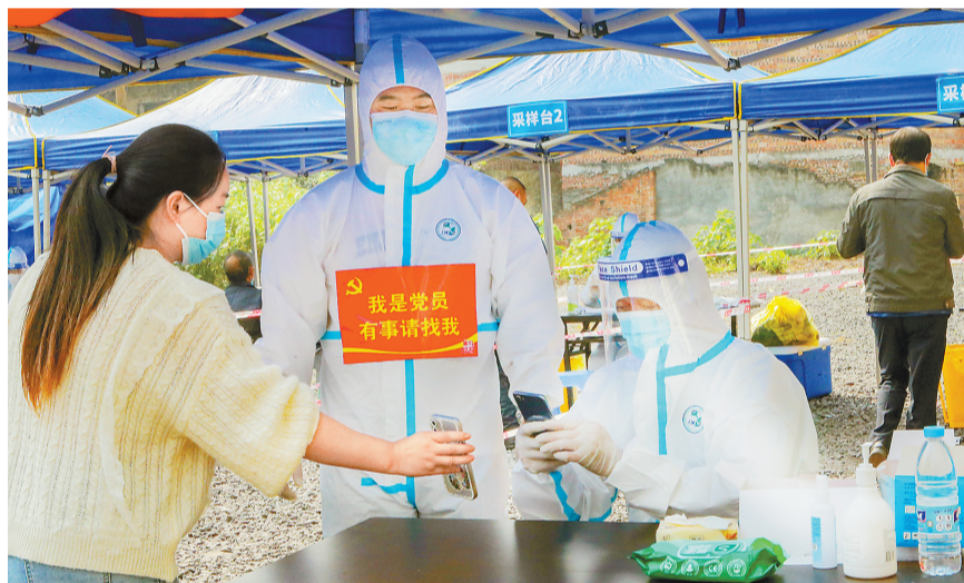
11月12日,万盛经开区万盛街道万北一社区核酸采样点,社区党员志愿者在宣传防疫知识、秩序维护。