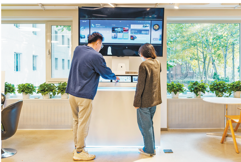
梧桐车联产品体验。