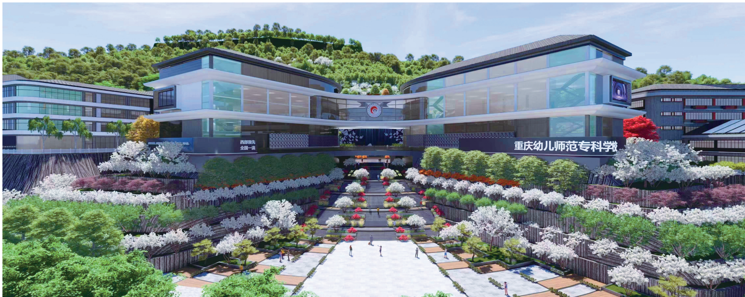
重庆幼儿师范高等专科学校梨园校区效果图