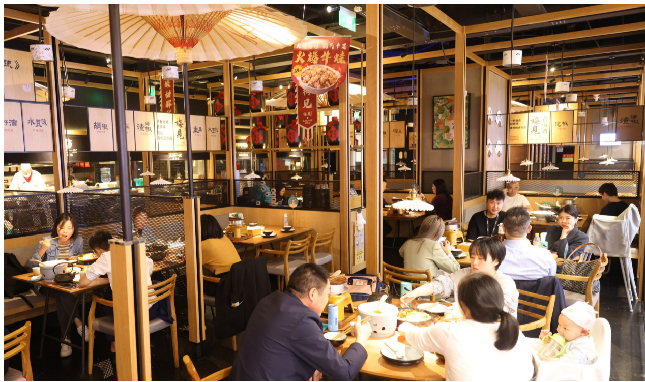
民生银行重庆分行餐饮小微企业发展注入新动力

行列入服务国家战略重点区域的重点分行，该行紧密围绕重大项目，支持一批优质铁路、公路、轨道交通等项目，并着力在新能源设备领域不断创新突破，今年在川渝共建重大项目上授信额度106亿元，同时针对优质重点项目，争取信贷额度和差异化政策。