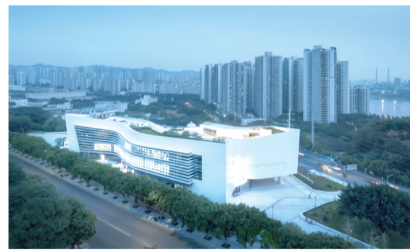
三峡文物科技保护基地

完成纳入党史学习教育“我为群众办实事”清单的60个革命文物保护项目,王朴烈士故居、蜀都中学旧址等一