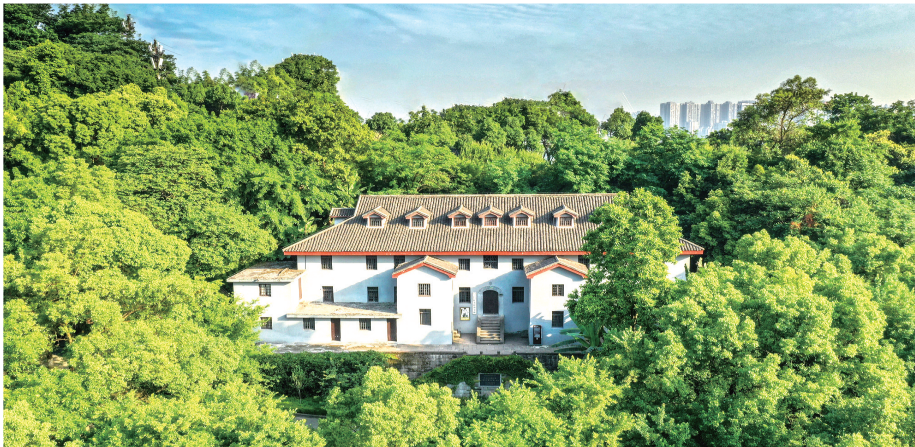
中共中央南方局暨八路军驻重庆办事处旧址