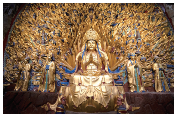
世界文化遗产大足石刻宝顶山8号千手观音