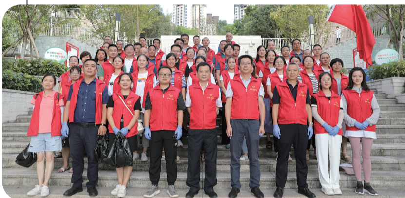
巴南职业教育中心“乐善”志愿服务队