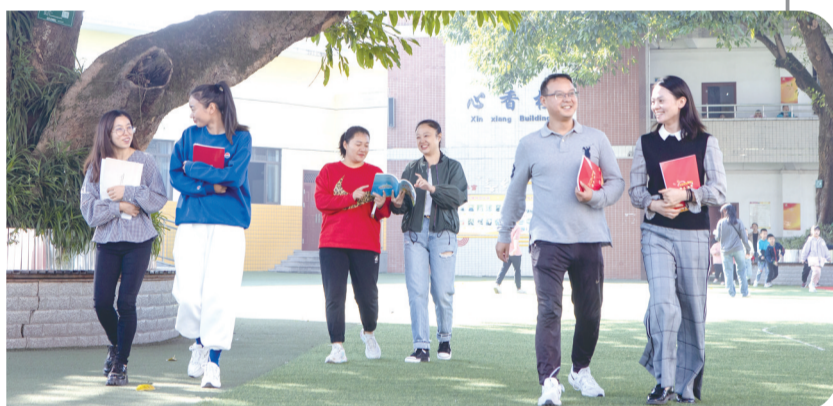
界石小学“梅香”志愿团队