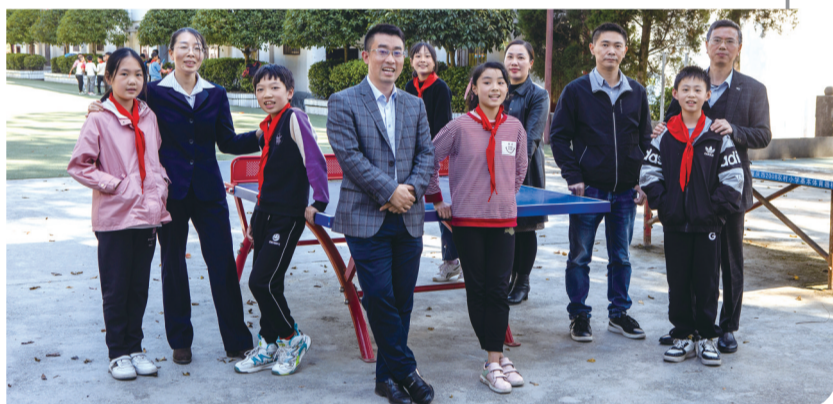
巴南区花石小学管理团队