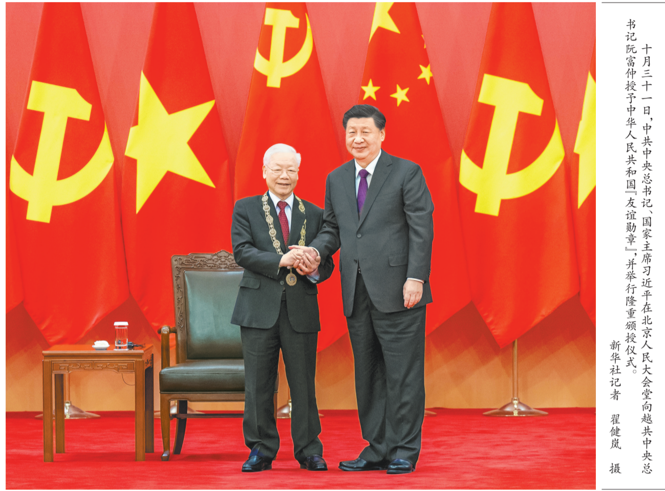
十月三十一日,中共中央总书记、国家主席习近平在北京人民大会堂向越共中央总书记阮富仲授予中华人民共和国“友谊勋章”,并举行隆重颁授仪式。