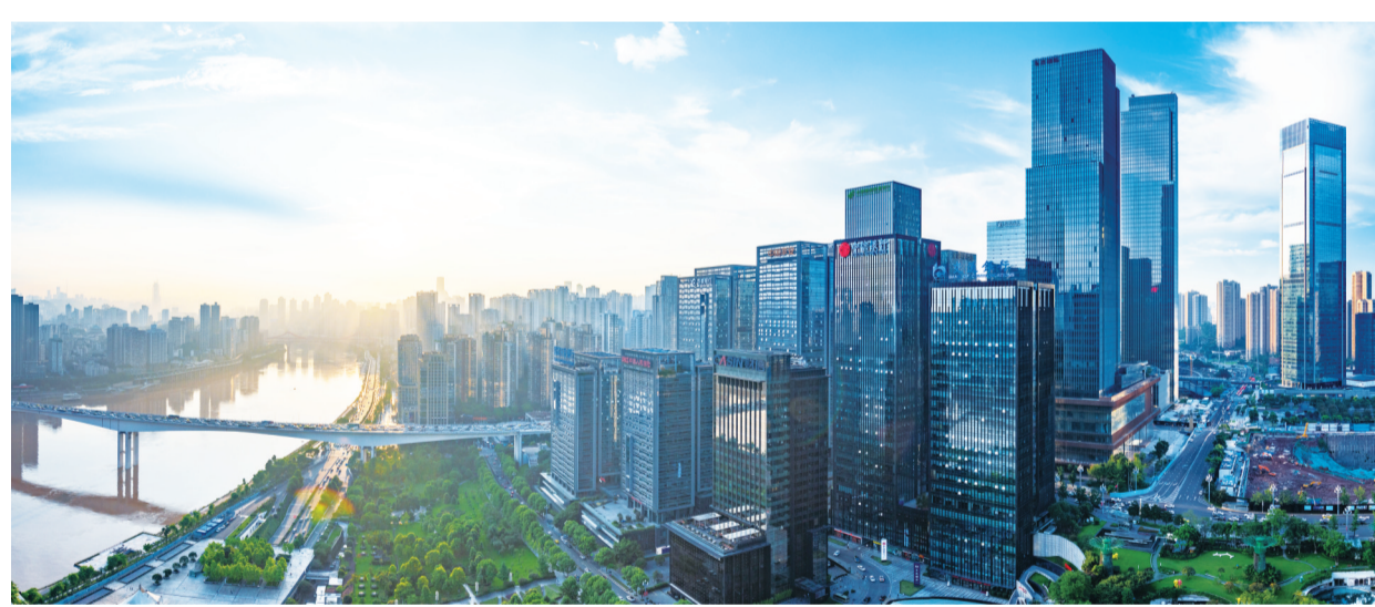
邮储银行重庆分行积极参与江北嘴金融党建先行区共建工作。

在曾是国家级贫困县的云阳县，邮储银行充分发挥基层党组织和党员“两个作用”，着力破解业务发展难题、完成急难险重任务，成为助力当地打赢脱贫攻坚战和推动乡村振兴工作中的中坚力量。自被纳入扶贫主