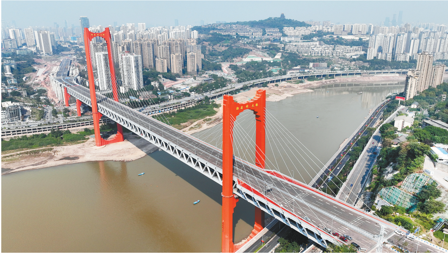
10月21日,即将通车的红岩村大桥。