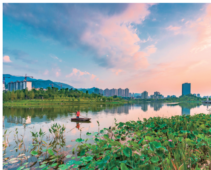
垫江牡丹湖湿地公园