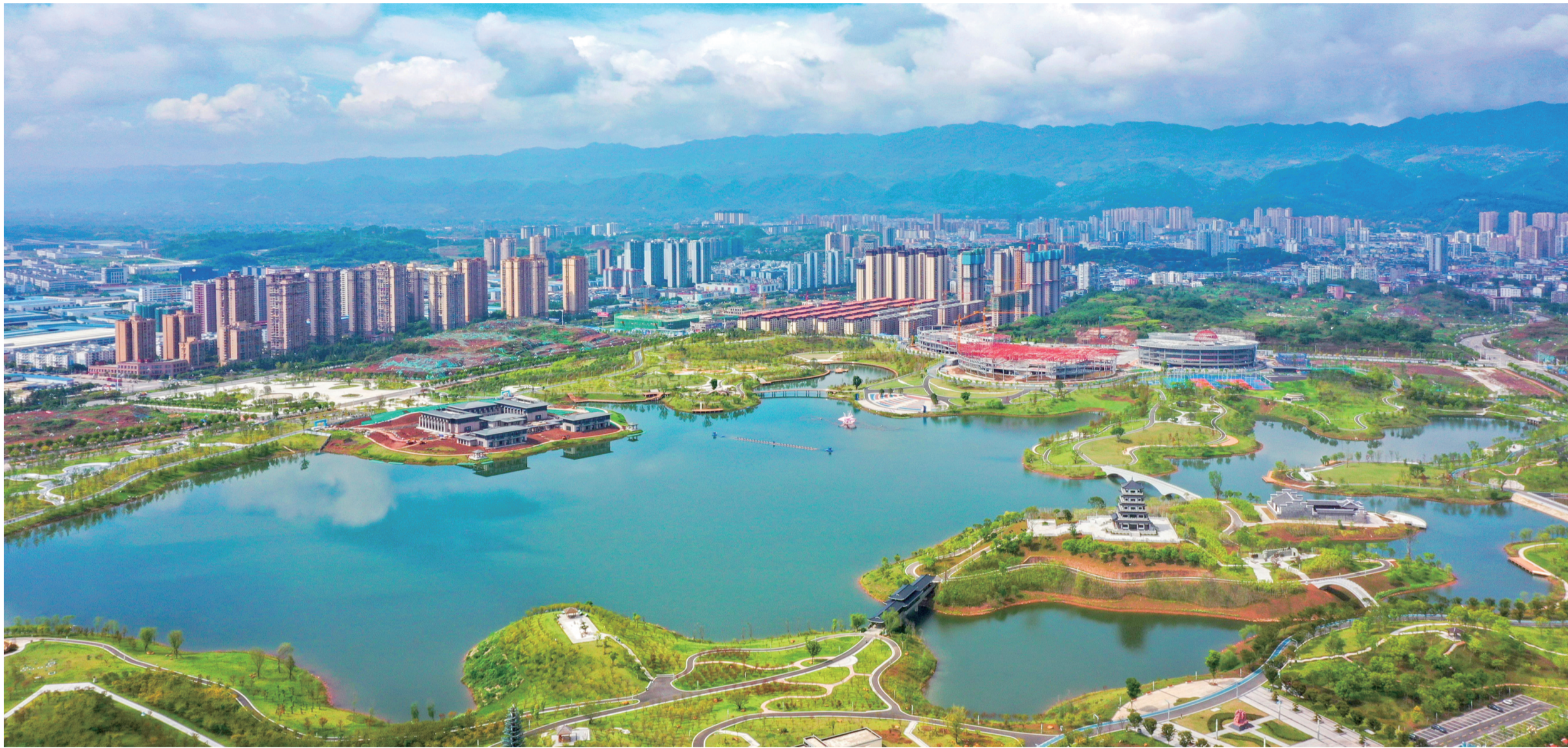
垫江东部新区三合湖湿地公园