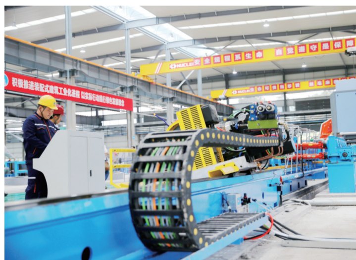
国瑞装配式建筑产业园厂房内景

此外，垫江高新区还建立了项目联系领导及项目秘书制度、企业问题台账及限时办结制度等，充分利用“垫小二”企业综合服务平台，及时收集解决影响企业发展的“拦路虎”，全力保障企业健康发展。