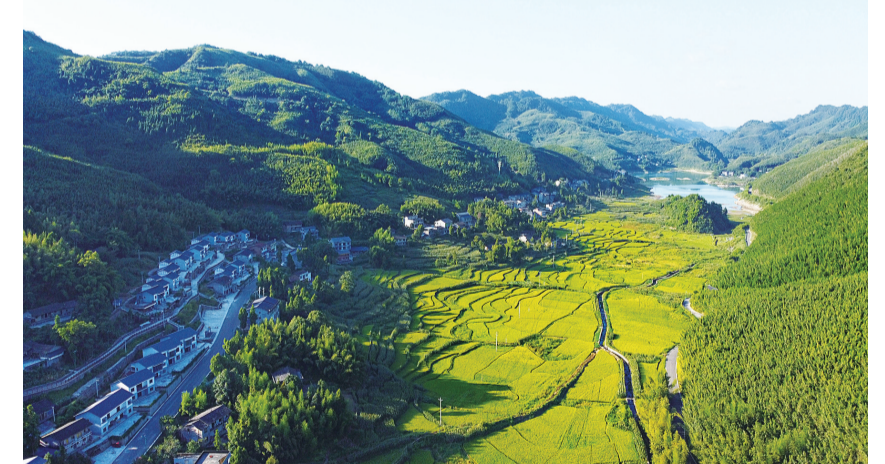
明月山·百里竹海有35万亩连片竹林，是梁平人民的金山银山。

“百里竹海翠欲滴，山水之间最中国。您现在看到的是重庆梁平区的百里竹海景区……”10月22日，中央电视台播出了梁平牢固树立和践行“绿水青山就是金山银山”理念推动绿色发展的视频，将百里竹海“竹山变金山”的故事展示到全国人民眼前。 百里竹海位于明月山，因绵延百里而得名。这里竹、木、矿产资源丰富，先后经历过“靠山吃山”的无序开采、痛定思痛的转型升级、坚定不移的绿色发展，在“绿水青山就是金山银山”理念指引下，最终走出了一条生态美、产业兴、百姓富的可持续发展之路。 靠山吃山 矿产资源枯竭碧水青山不再 “地上绿色竹海，地下黑色煤矿”曾是百里竹海的真实写照。这里有35万亩连片竹林，水源充沛、群山叠翠。 随着建筑行业的兴起，山里储量巨大的石膏矿一夜之间成为了人人趋之若鹜的“金矿”。随着采矿作业区的不断扩展，矿产资源快速枯竭，恶性循环