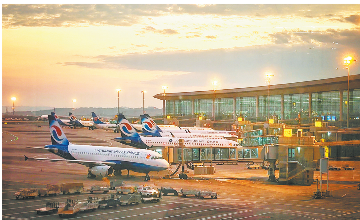
繁忙的重庆江北国际机场。