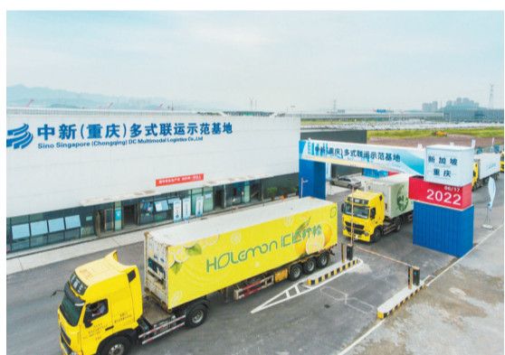
重庆果园港国家物流枢纽,中新(重庆)多式联运示范基地联运班车发车。