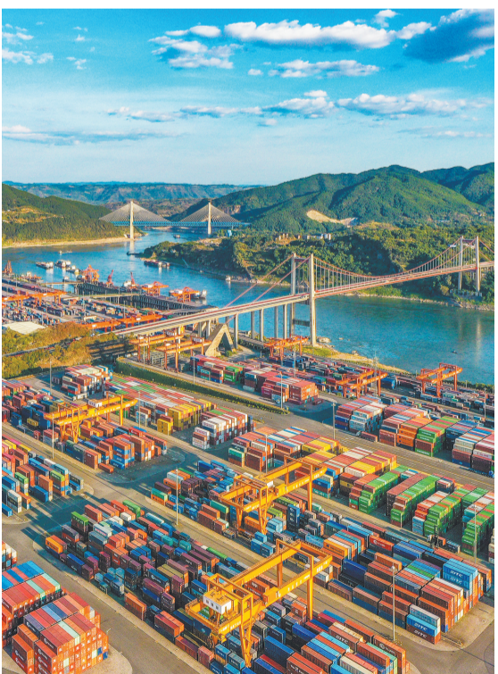
重庆果园港,无人化、智慧化的集装箱码头。