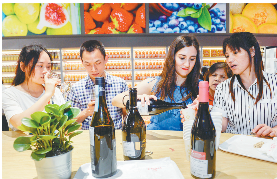
重庆首个“一带一路”进口商品体验交易平台——奇柯世界汇。