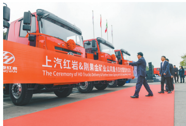
上汽依维柯红岩商用车有限公司,出口刚果(金)的重卡整装待发。