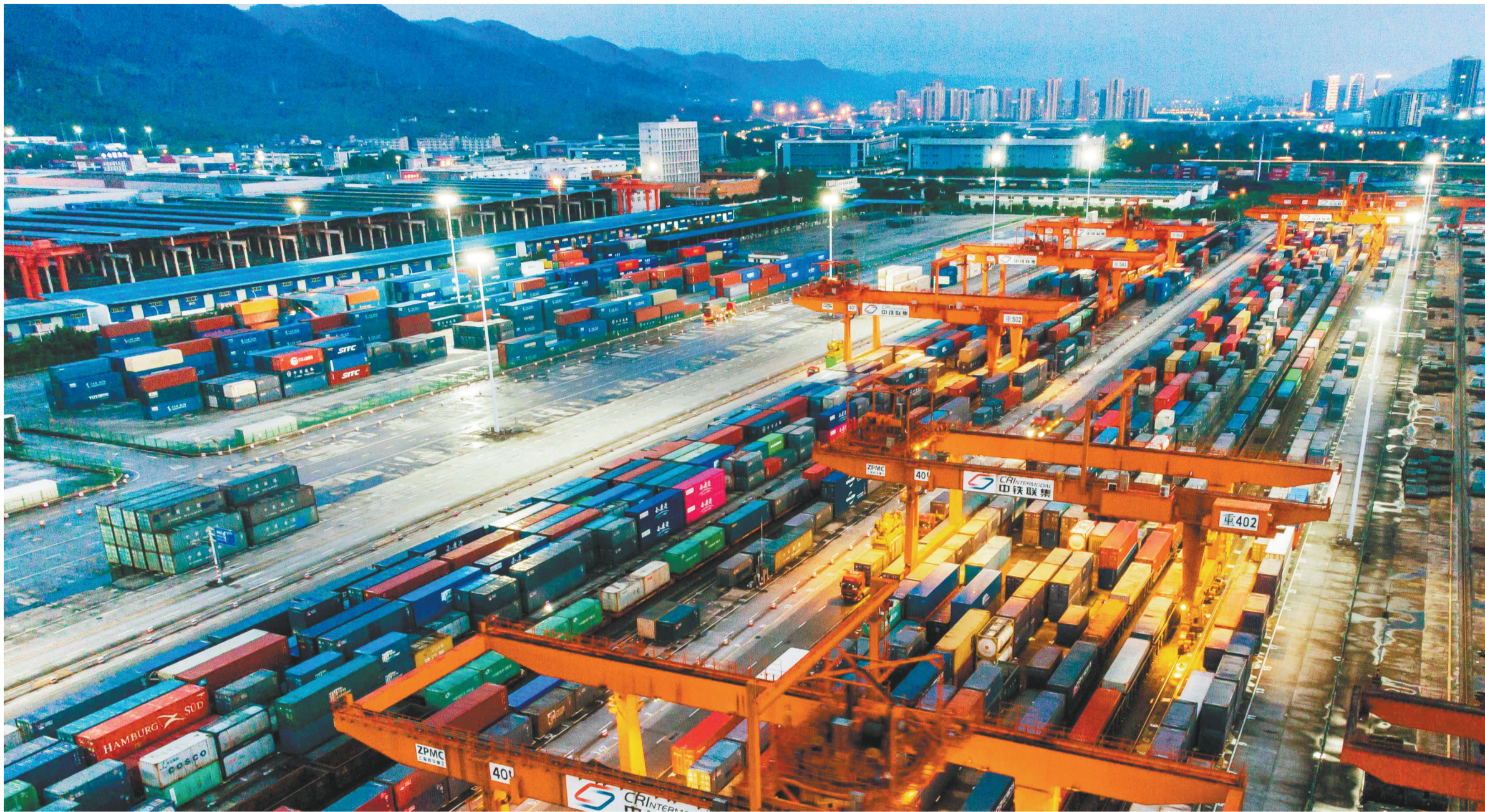
沙坪坝,重庆国际物流枢纽园区团结村铁路中心站灯火通明,一片繁忙景象。