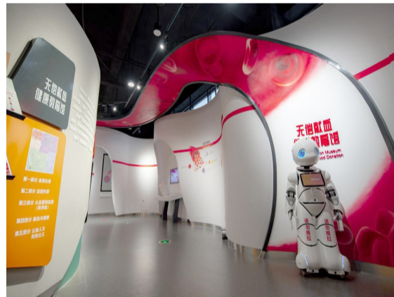
无偿献血健康教育馆