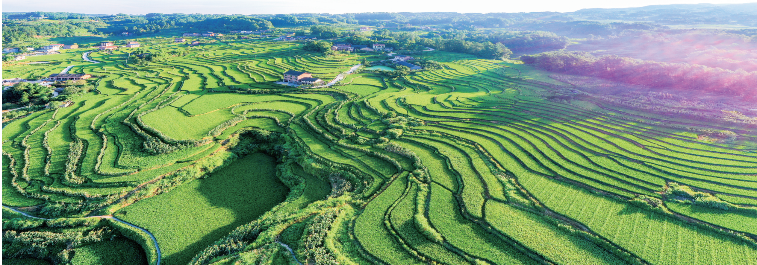
石溪镇南茶梯田，南川米生产基地