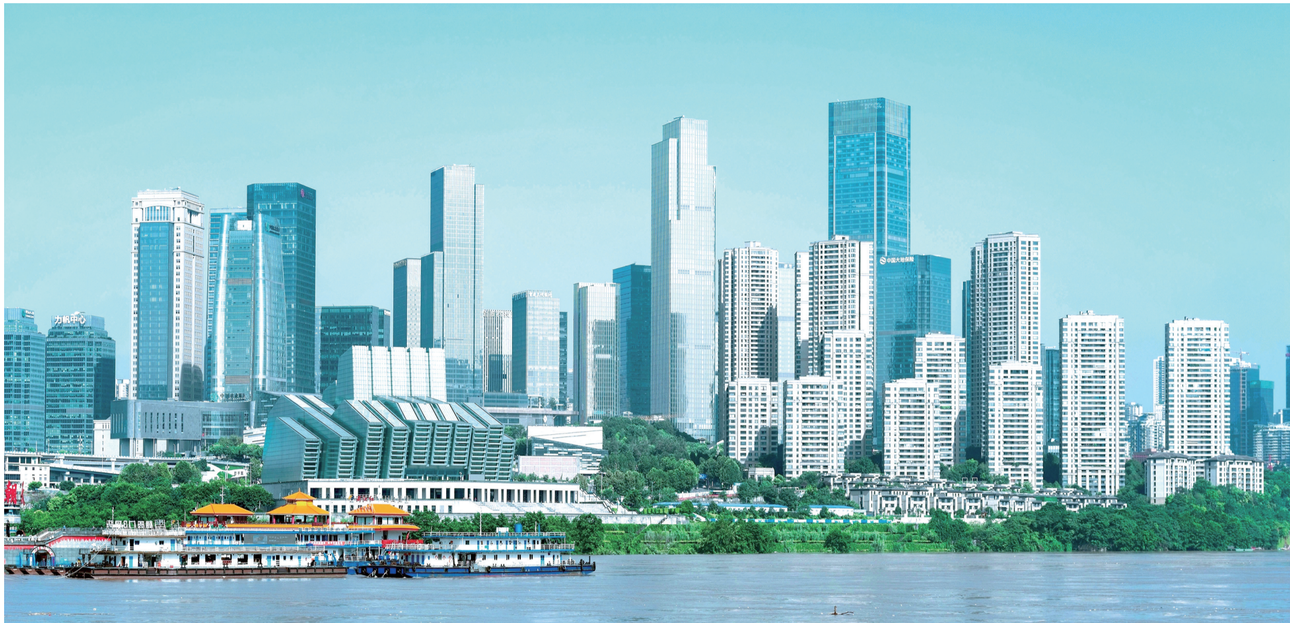
“两江四岸”的一道靓丽风景——江北嘴江岸线