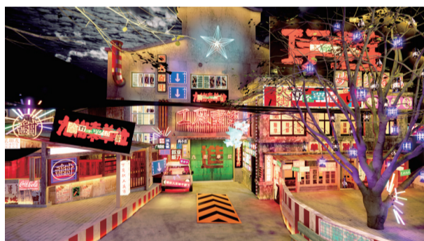
“九街有个单位”文创潮流街区

所谓“双核”，一是江北嘴，二是观音桥。两地分别是江北区打造西部金融中心核心承载区、国际消费中心城市首选区的产业空间，担好“两副担子”，对于推动江北区新一轮高质量发展的意义非同凡响。