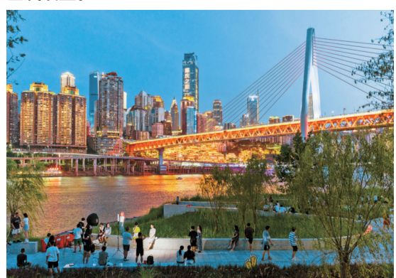
江北嘴江滩公园，游客与重庆夜景合影

值得期待的是，预计今年底，相国寺滨江公园、盘溪河滨江公园也将向市民全面开放；洋炮局文创生态湾和嘉陵江星悦活力湾两段贯通工程将于明年全线竣工。