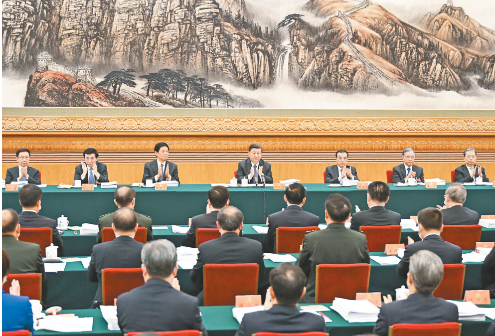
10月18日,中国共产党第二十次全国代表大会主席团在北京人民大会堂举行第二次会议。习近平、李克强、栗战书、汪洋、王沪宁、赵乐际、韩正等出席会议。新华社记者 李学仁 摄

新华社北京10月18日电 中国共产党第二十次全国代表大会主席团18日下午在人民大会堂举行第二次会议。