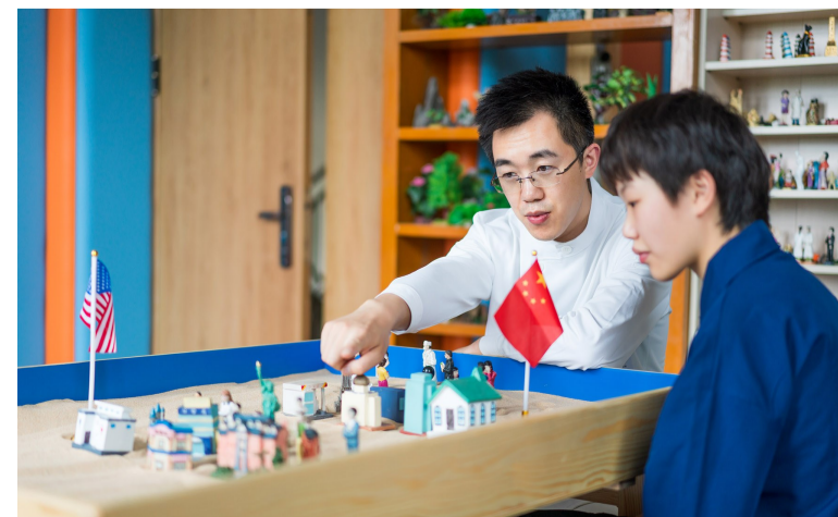
医务人员利用沙盘为患者开展治疗