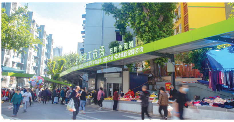
整治后的冶金三村便民市场

当前,九龙坡区“小而美”惠民提升行动已取得阶段性成效,完成了劳动三村改造提升、冶金三村便民市场提升等22个项目,赢得广大市民一致认可和广泛好评。