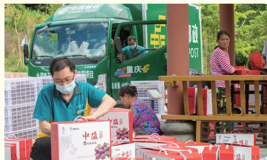
重庆邮政助力脆红李合作社实现产销一条龙

在刚过去不久的罕见高温天气下，盛产于重庆市永川区的“消暑神器”——黄瓜山梨成熟期缩短，大量果实亟需采摘。中国邮政集团有限公司重庆市分公司（下文简称：重庆邮政）闻讯后，立即救急，提供采摘、打包、销售等服务。这场“及时雨”，源于永川黄瓜山梨与重庆邮政打造的“双链工程”合作多年的默契，也是重庆邮政参与县域商业建设行动的经验成效之举。 重庆市商务委市场体系建设处相关负责人介绍，重庆将邮政的资源、渠道、服务优势深度纳入县域商业体系建设，围绕健全农村流通网络、培育县域商业市场主体、优化农村消费和服务环境、提高农产品流通效率、强化农业农村优先发展金融保障5个方向，帮助重庆邮政形成了独具特色的综合协同一体化服务体系。