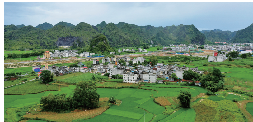
东风日产创新帮扶立星村

百年大计，教育为本。让偏远地区的孩子们接受良好教育，是创新帮扶助力乡村振兴的重要任务。2020年以来，东风日产全面加强了对立星小学的教育帮扶工作，先后投入约350万元，实施整体提升计划。新建综合楼1栋、新建校园文化墙，翻新附属幼儿园旧楼；建成美术室、音乐室、电脑室、科学实验室等11个功能室；实施开展“阳光关爱·i读计划”活动，帮扶组建天籁合唱团；开展图书漂流、公益课堂，每年多次到立星小学举行帮扶关爱活动，托起“祖国花朵”的未来。