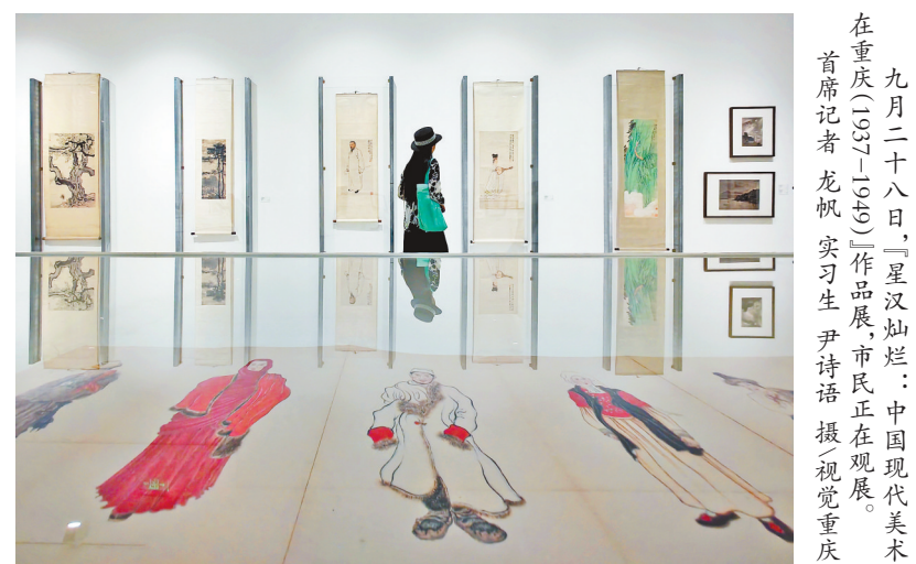
九月二十八日，“星汉灿烂：中国现代美术在重庆(1937-1949)”作品展，市民正在观展。

10月2日，重庆日报融媒体中心将对展览进行直播，为观众解锁该展览的更多精彩。此次展览将持续至12月20日，市民可通过四川美术学院美术馆公众号预约免费观展。