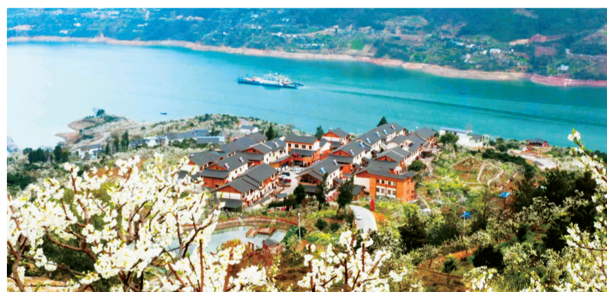
风景如画的三峡库区