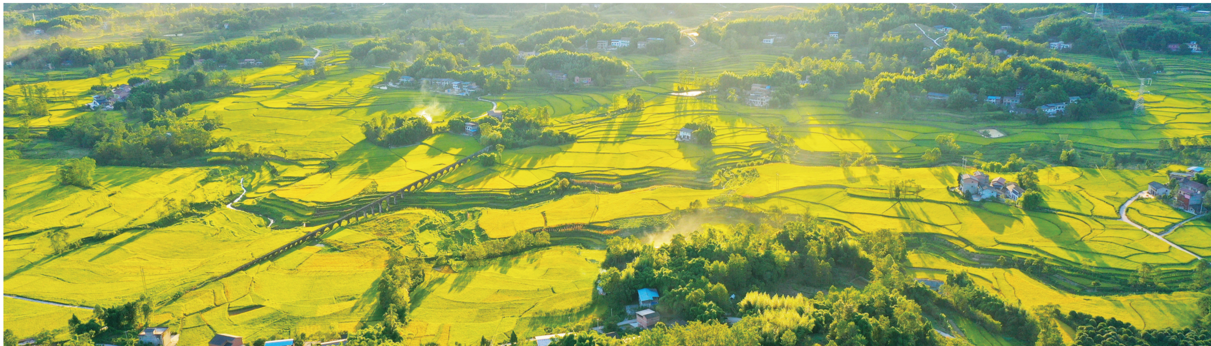
“万企兴万村”绘就乡村好“丰”景