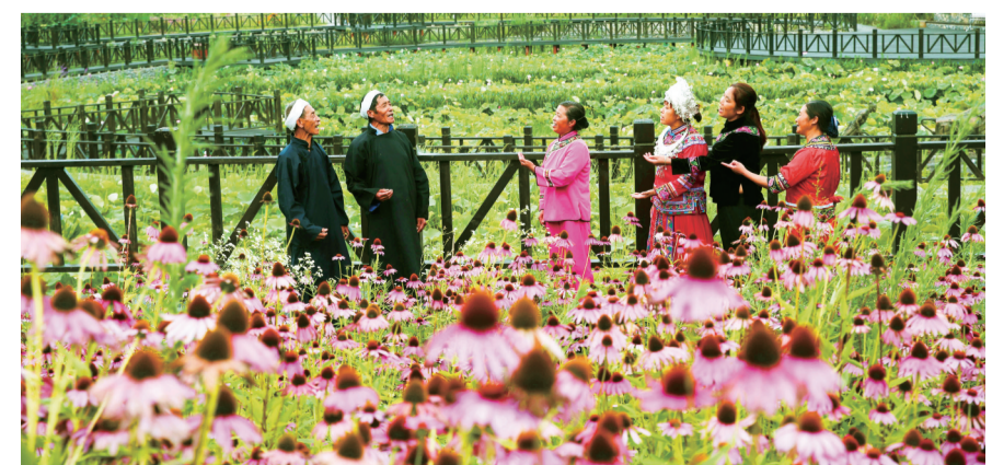
农业强、农村美、农民富