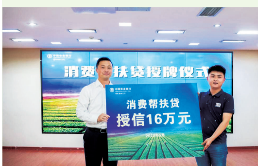
消费帮扶助力“万企兴万村”