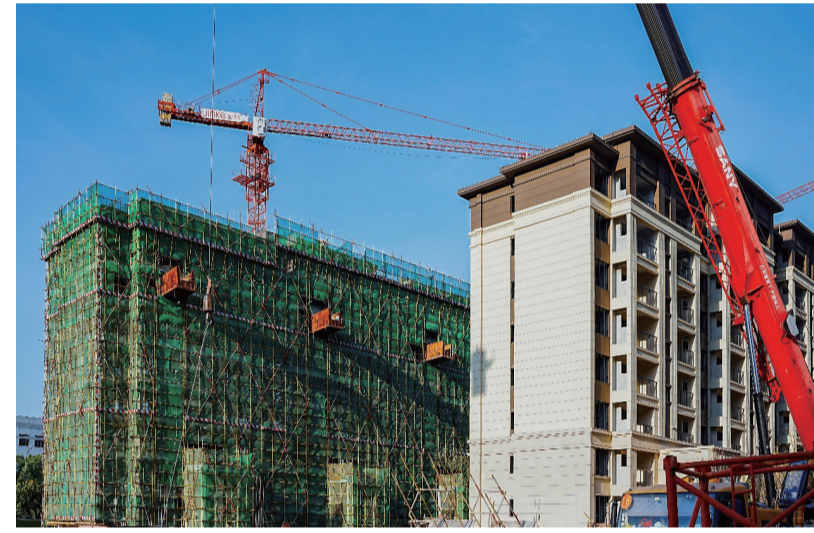
天壹府项目施工现场