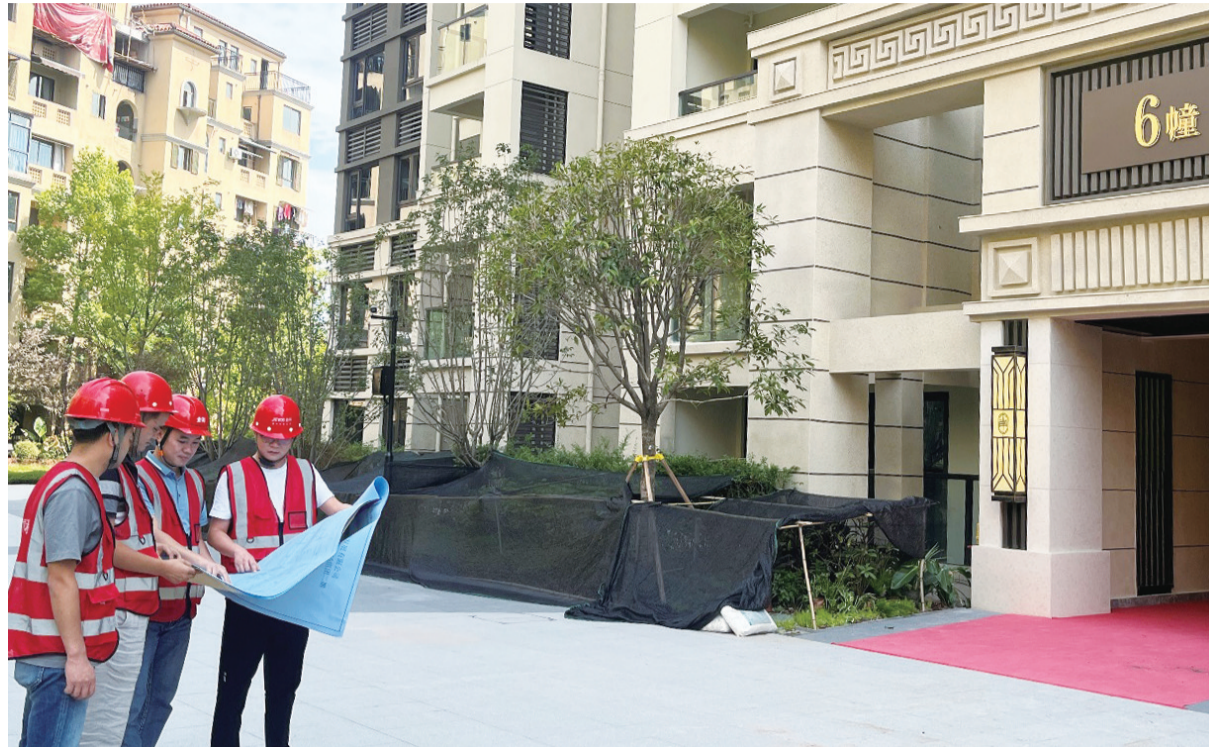
金科南山交付之前,工程团队正在进行最终的检查

战高温、战疫情、战市场。金科人用项目的交付说话,用交付的品质发声,用销售的数据证明,金科还是那个金科,能够兑现万千家庭的美好承诺。