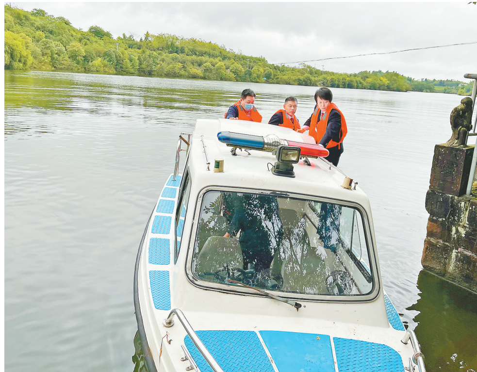
图为市检察院一分院对青云水库生态环境保护开展“回头看”。