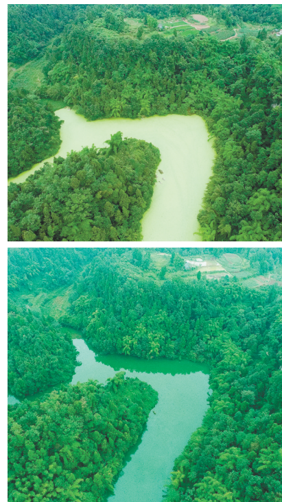
青云水库治理前后对比图。