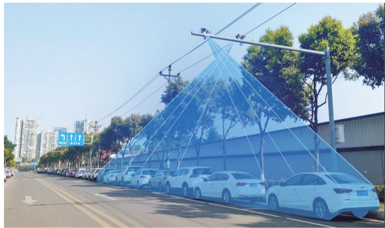
旗龙路高位视频监测