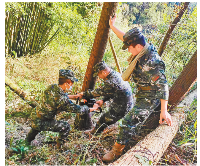
▲8月22日,在巴南区界石镇,武警重庆总队机动支队的官兵在开辟隔离带。