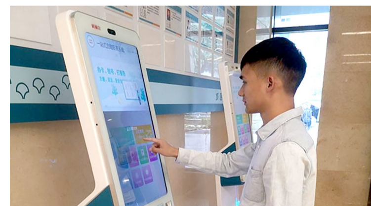
正在使用一站式自助机进行业务办理的市民

在医疗支付方面，医院推出线上支付功能，患者可使用微信、支付宝等便捷支付方式完成缴费。使用医保卡支付的患者，可通过医保电子凭证二维码扫码、