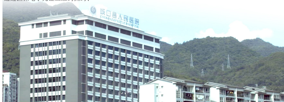
城口县人民医院大楼