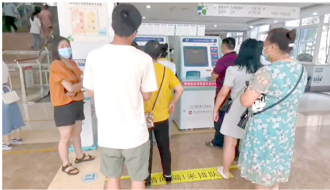
彭水县人民医院一站式自助服务系统

8月19日上午，彭水县人民医院门诊大厅，群众正排队使用“一站式自助服务终端”。前来就诊的患者轻松地在线上点了几下，便迅速结束了所有就诊费用，旁边还有志愿者耐心讲解。这仅仅是彭水县人民医院推进智慧医院建设的一个缩影。