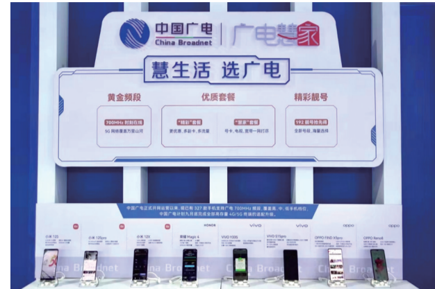
广电慧家业务及终端展示