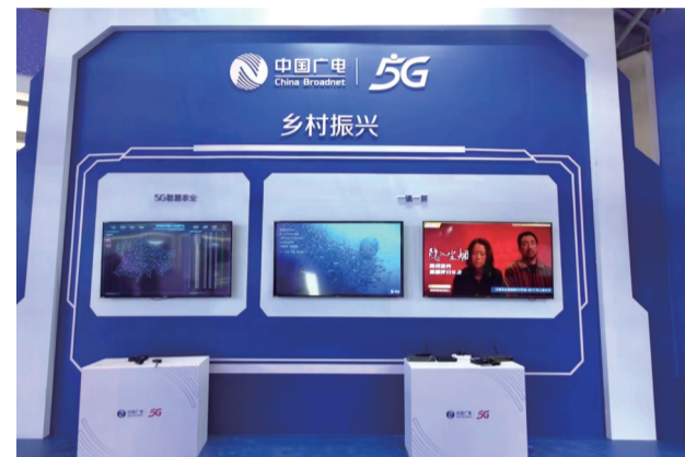
推动乡村振兴和智慧广电深度融合

网”的内容资源，中国广电重庆公司充分利用5G+AI/AR+4K/超高清技术，创新打造慧游巴蜀、巴渝文旅云、云上智慧博物馆等文化数字化公共服务平台，通过多屏互动、云网融合形式，打造精彩内容体验。