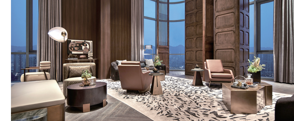
T1空中圈层会客厅红酒雪茄吧