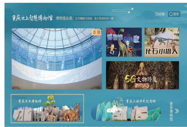
“重庆云上智慧博物馆”文博数字体验服务平台