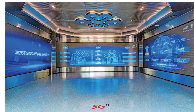
中国联通重庆市分公司5G数字智慧体验馆

基于智家应用场景搭建的智能实体沙盘+XR互动体验的一站式解决方案,用户可直观了解智家产品在家庭场景中的使用体验,也可通过XR设备进入另一个家庭元宇宙世界进行沉浸式体验。”中国联通展台相关负责人介绍。