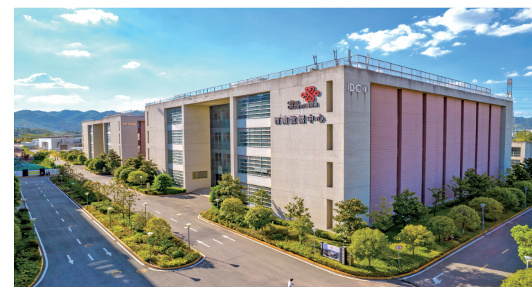
中国联通西南数据中心