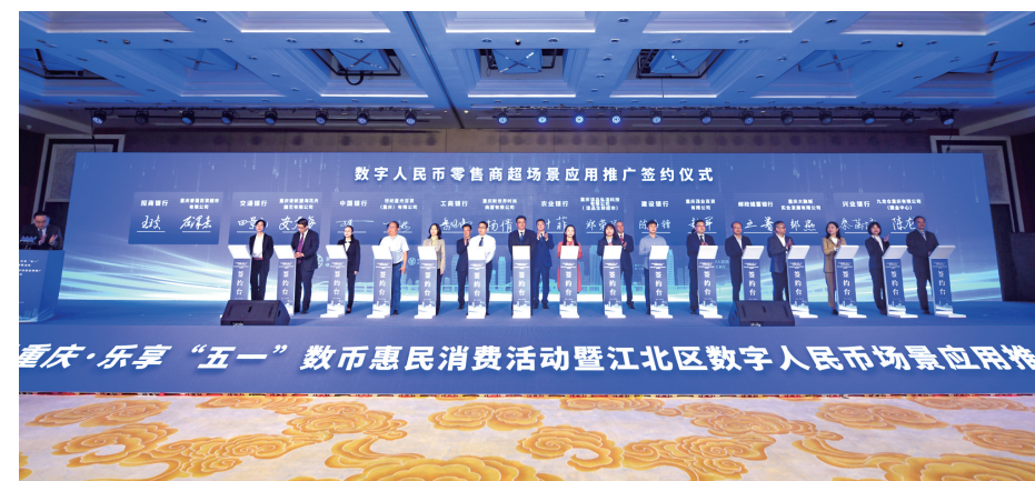
江北数字人民币零售商超场景应用推广签约仪式