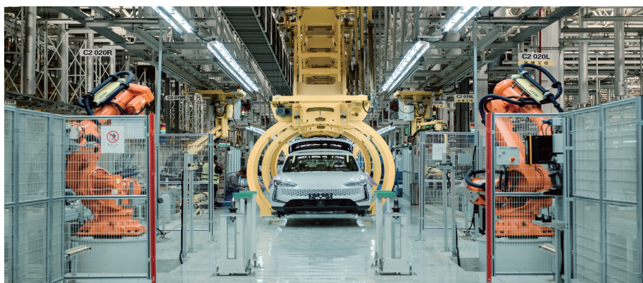
重庆金康新能源汽车有限公司智能工厂

的智慧工厂里，以数字化、智能化为核心驱动，以数字化、网联化为基础，通过1000余台机器人协同，实现关键工序100%自动化，24小时在线监测，在智能制造领域具备了领先优势。