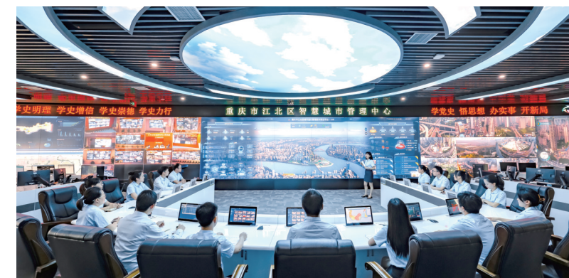
江北智慧城市管理中心

再如智慧监管，江北用大数据智能化实现食品安全一屏统揽，通过推行“互联网+明厨亮灶”，把食品安全“亮”出来，把食品隐患“找”出来，把食品风险“算”出来，实现了食品安全的全社会共治。目前，江北已接入明厨亮灶的单位1500余家，总数居全市第一。