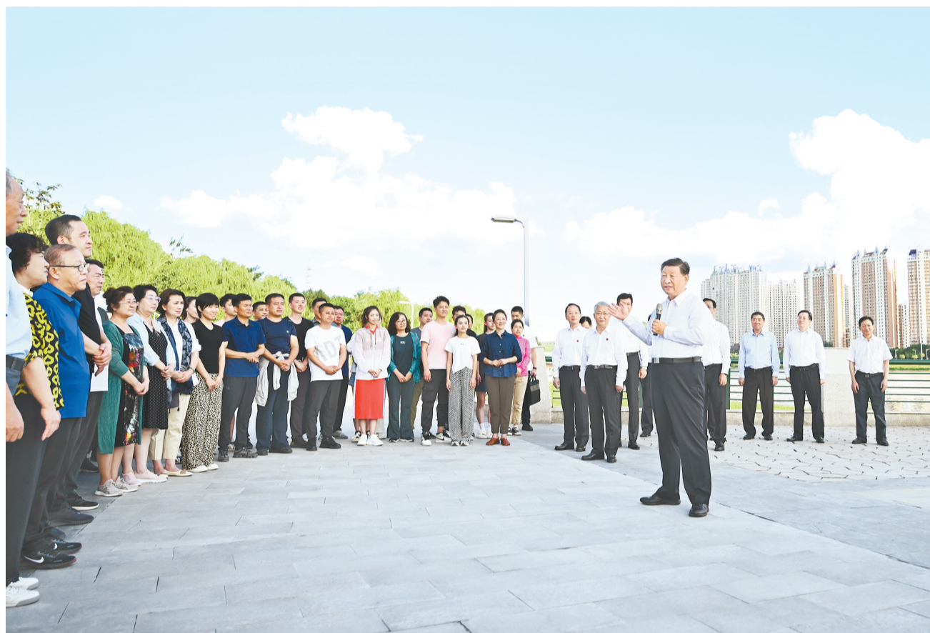
8月16日至17日,中共中央总书记、国家主席、中央军委主席习近平在辽宁考察。这是16日下午,习近平在锦州市东湖森林公园察看小凌河沿岸生态环境时,同正在休闲、进行文化活动的群众亲切交流。