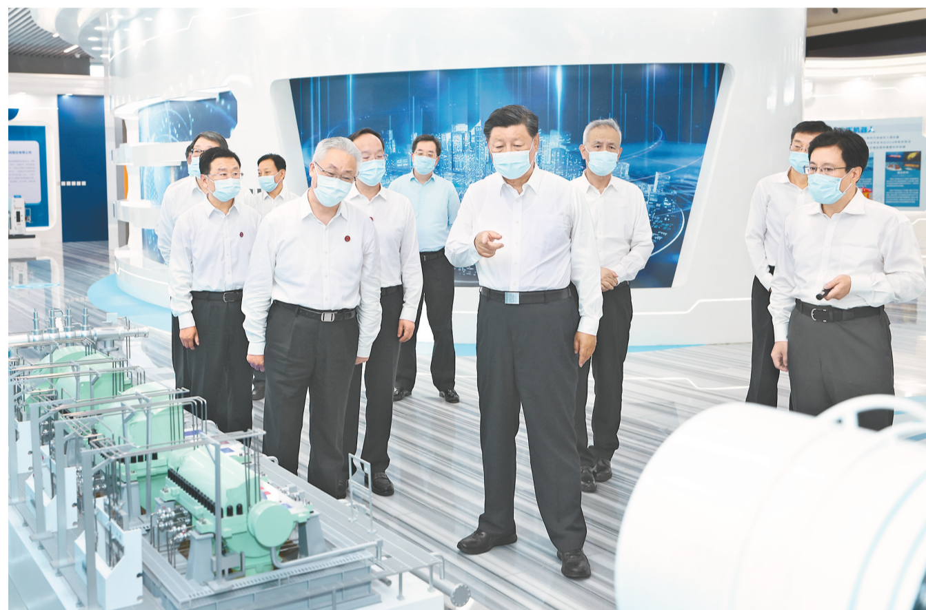
8月16日至17日,中共中央总书记、国家主席、中央军委主席习近平在辽宁考察。这是17日下午,习近平在沈阳新松机器人自动化股份有限公司展厅,察看辽宁先进科技产品集中展示。

新华社沈阳8月18日电 中共中央总书记、国家主席、中央军委主席习近平近日在辽宁考察时强调,要贯彻党中央决策部署,坚持稳中求进工作总基调,统筹疫情防控和经济社会发展工作,统筹发展和安全,完整、准确、全面贯彻新发展理念,坚定不移推动高质量发展,扎实推进共同富裕,加快推进治理体系和治理能力现代化,深入推进全面从严治党,在新时代东北振兴上展现更大担当和作为,奋力开创辽宁振兴发展新局面,以实际行动迎接党的二十大胜利召开。