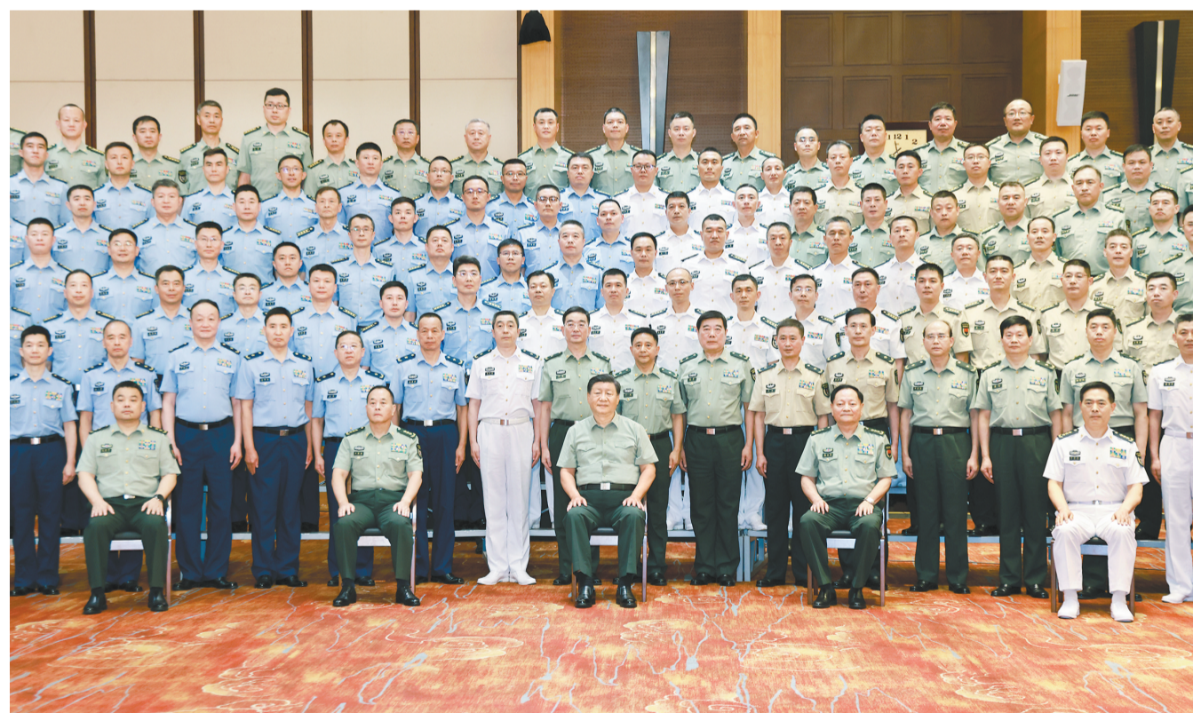
8月16日至17日,中共中央总书记、国家主席、中央军委主席习近平在辽宁考察。这是17日上午,习近平在沈阳亲切接见沈阳部队大校以上领导干部和团级单位主官,代表党中央和中央军委,向驻沈阳部队全体官兵致以诚挚问候,并同大家合影留念。

习近平现场听取了辽宁省防汛工作汇报。今年北方雨水偏多,辽宁入汛以来出现多轮强降雨过程,导致农作物受损、群众财产损失。辽宁省委和省政府在中央有关部门支持下,全力做好各项救灾救助工作,及时转移受灾群众近20万人,保证受灾群众有饭吃、有衣穿、有干净水喝、有临时安全住处、有病能及时就医,保持了社会大局稳定。(下转2版)