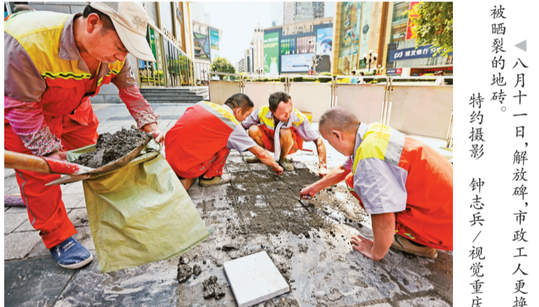
▲八月十一日,解救牌,市政工人更换被晒裂的地砖。

本报讯 (首席记者 龙丹梅)7月以来的连晴高温天气已造成我市多个区县土壤墒情,27.60万人因旱临时饮水困难。8月12日,重庆日报记者从市水利局获悉,针对当前旱情,市水利局已开展每日旱情动态会商和蓄水保供研判,坚持城乡饮水“日排查”制度,发现饮水安全问题及时动态清零,确保不漏一户不掉一人,全力抗旱保供水。