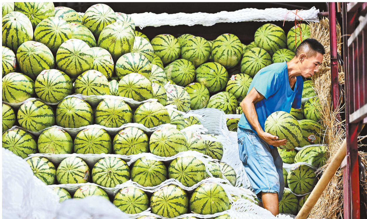
▲8月11日,渝北海领国际农产品交易中心,商家正在搬运西瓜。