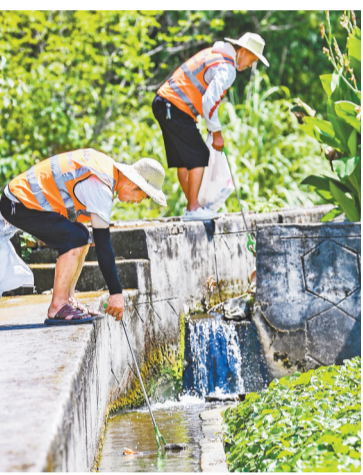
▲8月10日,西部(重庆)科学城梁滩河支流湿地,河库巡护员正在清理湿地里的垃圾。