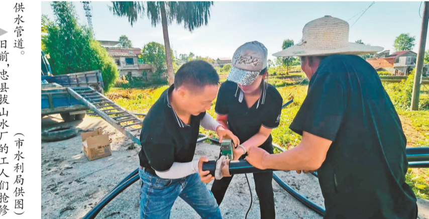
▲日前,忠县拔山水厂的工人抢修供水管道。