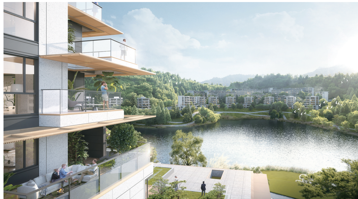
中央公园悦府（效果图）

8月8日，位于中央公园中心区的中央公园悦府项目迎来首次亮相，华润大厦44楼、观音桥北城天街两大城