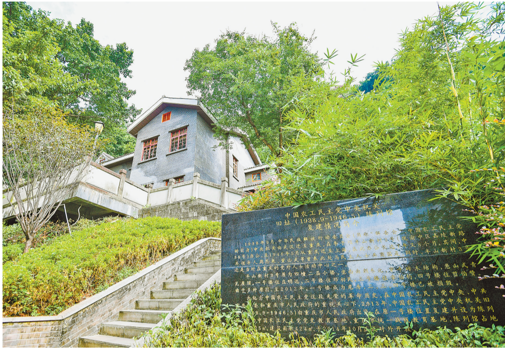
渝中区嘉陵新路55号,农工党中央机关在渝旧址陈列馆。

“武汉沦陷后,解委会(农工党的前身)就从武汉迁到了重庆。”张昌红说,农工党成立于1930年,是我国国内最早建立的民主党派,