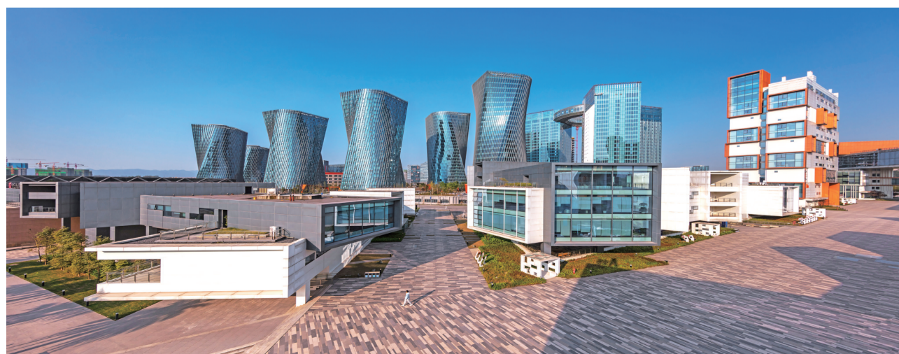
仙桃国际大数据谷