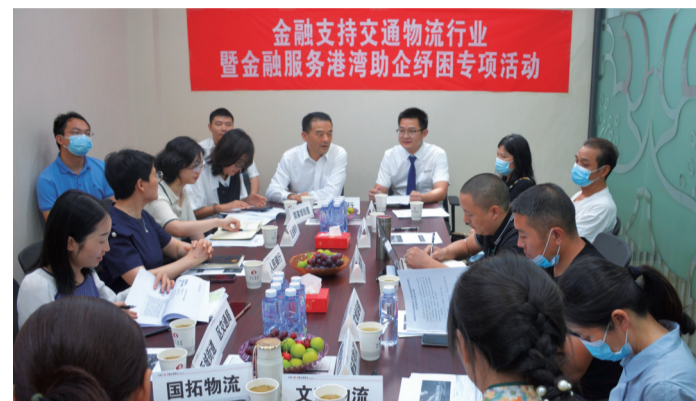
为企业精准“把脉”献金融“良方”