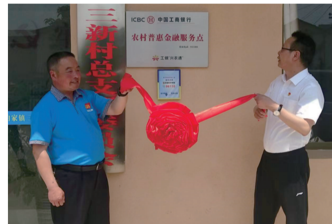
重庆梁平，“兴农通”农村普惠金融服务点正式挂牌

具体来说，对国家重点支持的民营企业，该行将建立“绿色通道”，利用科创金融创新融资产品，给予企业信贷支持；对受疫情影响较大的住宿餐饮、批发零售、文化旅游等接触型服务业及受疫情影响遭遇困难的民营企业继续提供稳定投融资支持，提供差异化金融服务，不盲目限贷、抽贷、断贷；对受疫情影响偿还贷款暂时困难的运输物流企业和货车司机，通过展期、再融资、调整还款计划等方式满足融资接续需求；对于经营正常、按期付息的小微企业给予无还本续贷政策支持，缓解企业资金压力等。