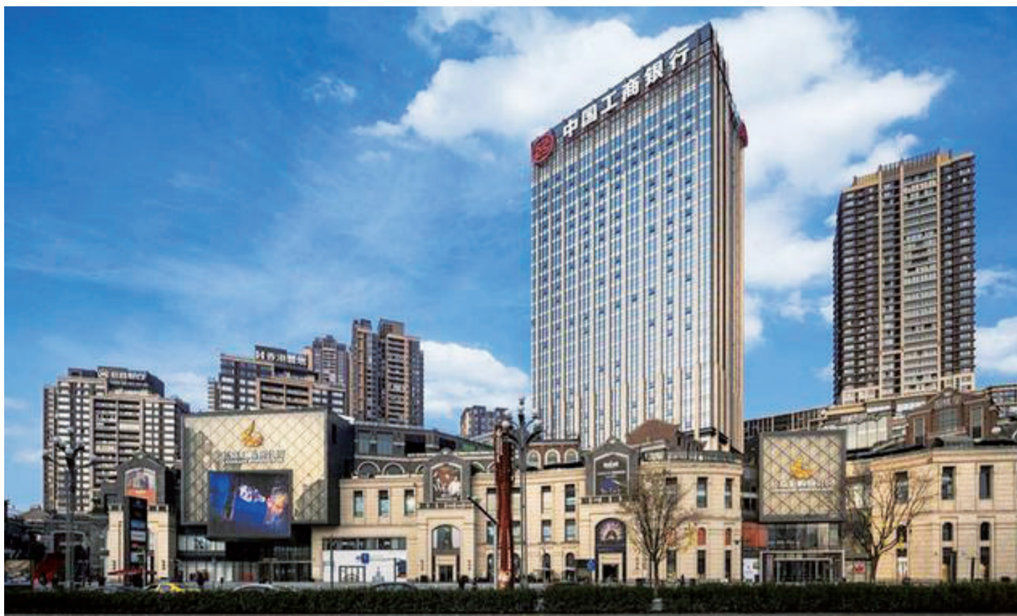
工行重庆市分行大楼