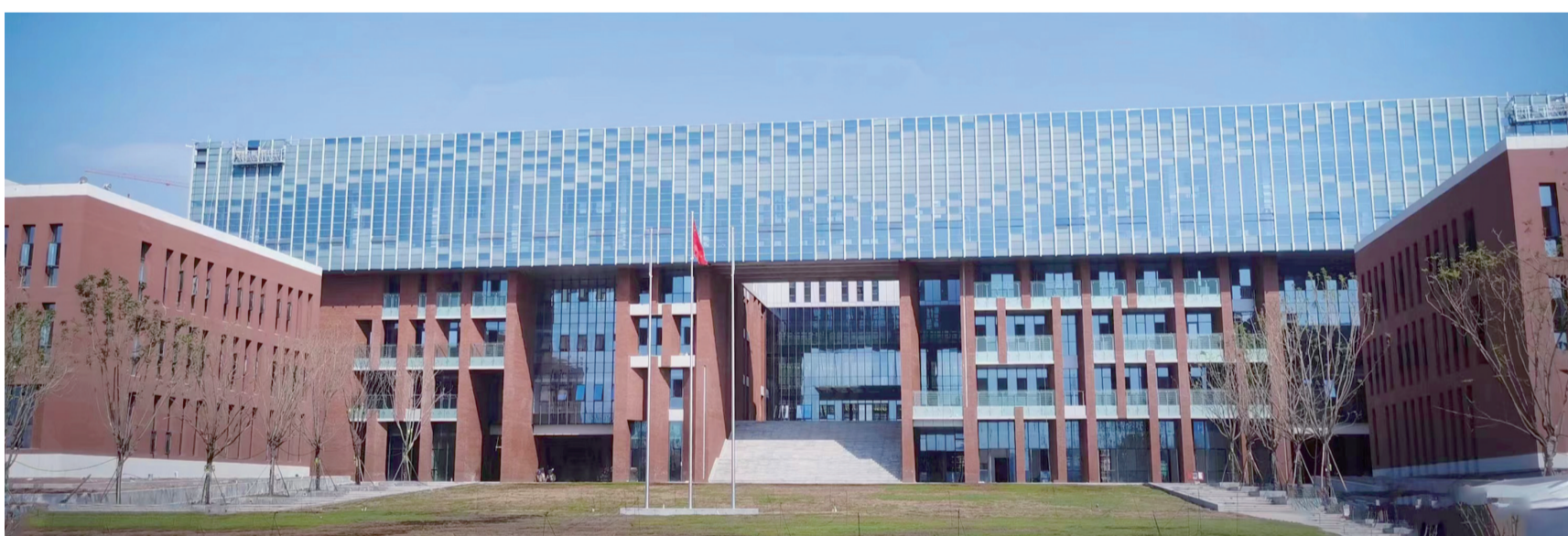
热致调光玻璃渝北区市民服务中心应用实景图

眼下赤日炎炎,谁不想有一个既阳光明媚又清凉节能的工作、生活环境?如今,有一款世界首创的新材料——热致调光玻璃,用作建筑外围护结构玻璃,就能让你如愿以偿。更有意义的是,这种新材料可能为全国建筑物带来15%左右的节能效果,将催生一个千亿级的新产业。