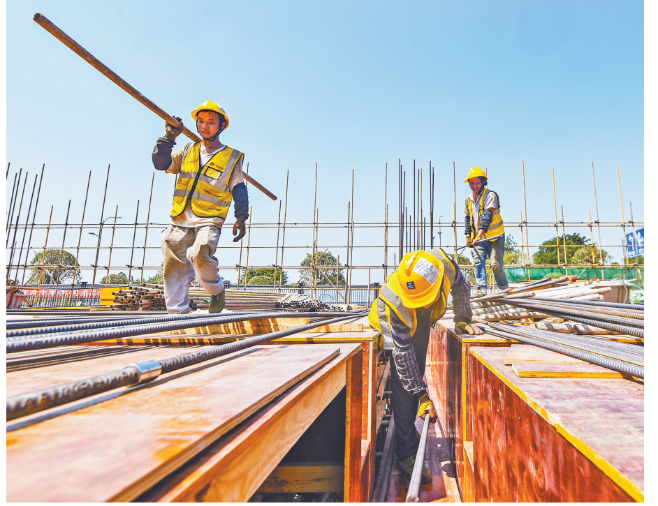
▲7月14日，荣昌区虹桥客运枢纽站项目，工人进行错峰作业。首席记者 龙帆 实习生 尹诗语 摄/视觉重庆