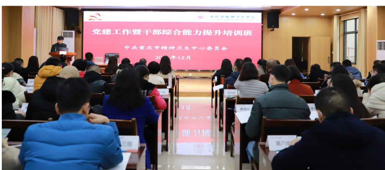
党建工作暨干部综合能力提升培训

换位体验项目，通过让医护人员切身体验患者卧床、喂食的速度、食物异常温度等，有效提升医护人员服务质量，提高患者住院护理质量；院办党支部开展的与黔江区金溪镇对口帮扶项目，让党员干部参与基层治理，帮助当地解决精