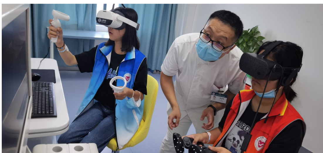
市精卫中心的患者正在接受虚拟现实(VR)治疗