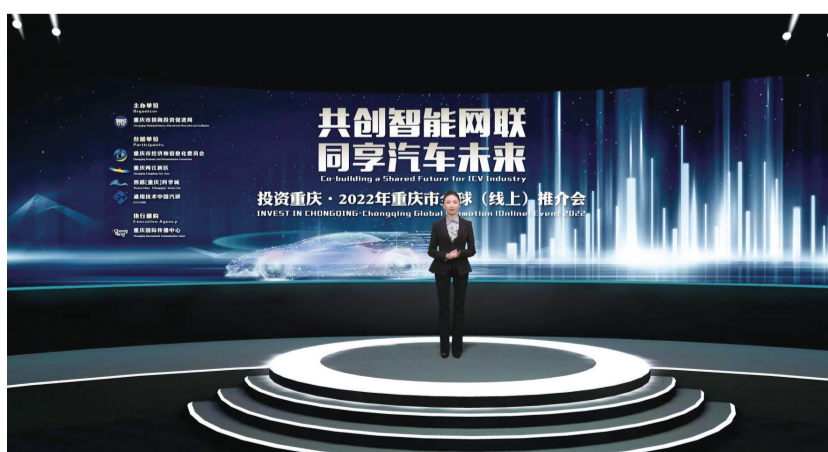
市招商投资促进局推介“重庆制造”新能源汽车

据介绍,目前全市各部门、各区县、各开发平台招商宣传均纳入“投资重庆”品牌营销。重庆市招商投资局