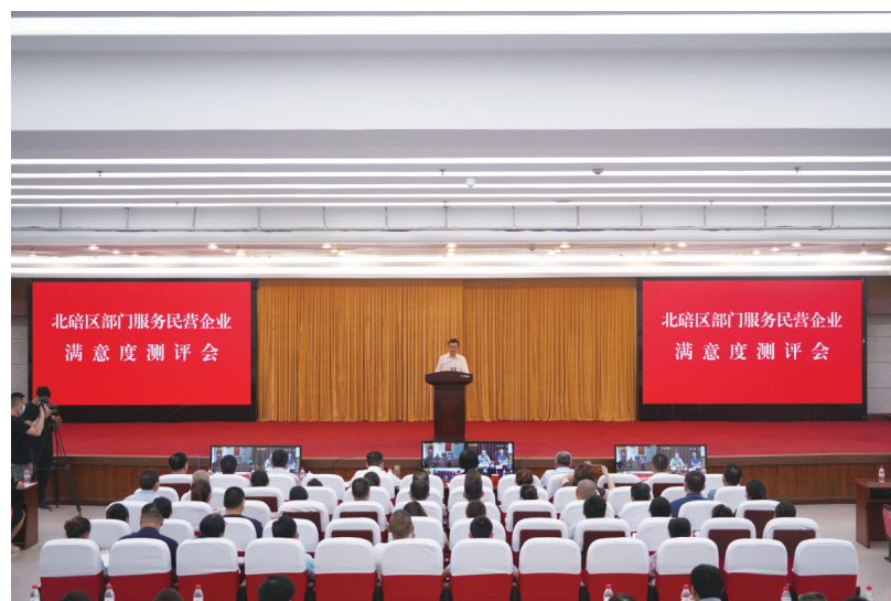
7月6日,北碚区部门服务民营企业满意度测评会召开