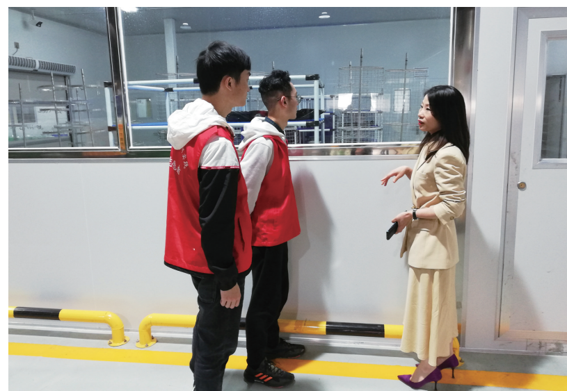
童家溪镇开展“一企一事一办”,工作人员与重庆天利灯具邮箱公司负责人进行交流