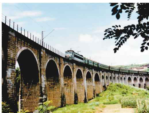
▲1995年，电力机车牵引的旅客列车行驶在成渝铁路王二溪石拱桥上。