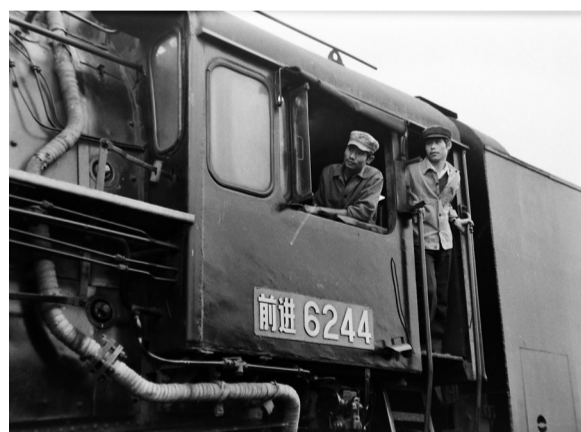
▲上世纪80年代，成都机务段前进型6244号机车乘务组乘务员正在值乘。