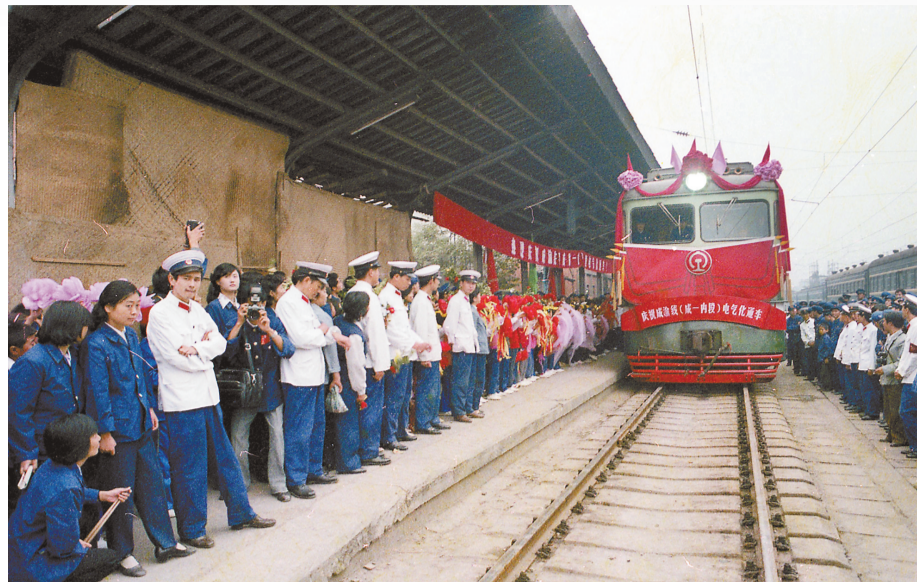
◀成渝铁路全线进行电气化改造。1994年10月1日，成都至内江段通车剪彩。