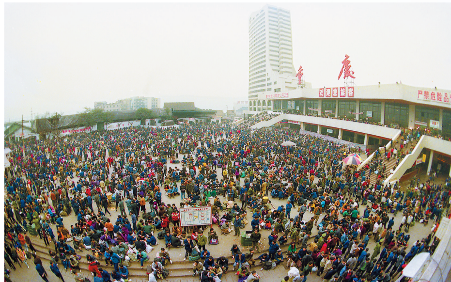
►1993年春运，重庆菜园坝火车站等待购票、乘车的旅客。