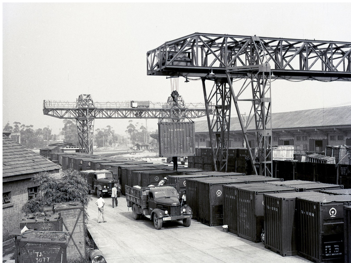
▲1984年，成都东站货场内正在装运集装箱。