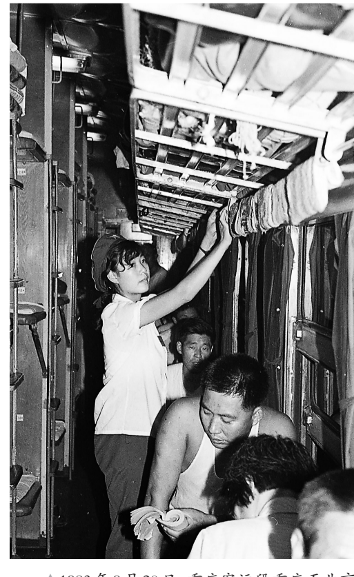
▲1983年9月20日，重庆客运段重庆至北京特快列车京快四组乘务员在整理毛巾。