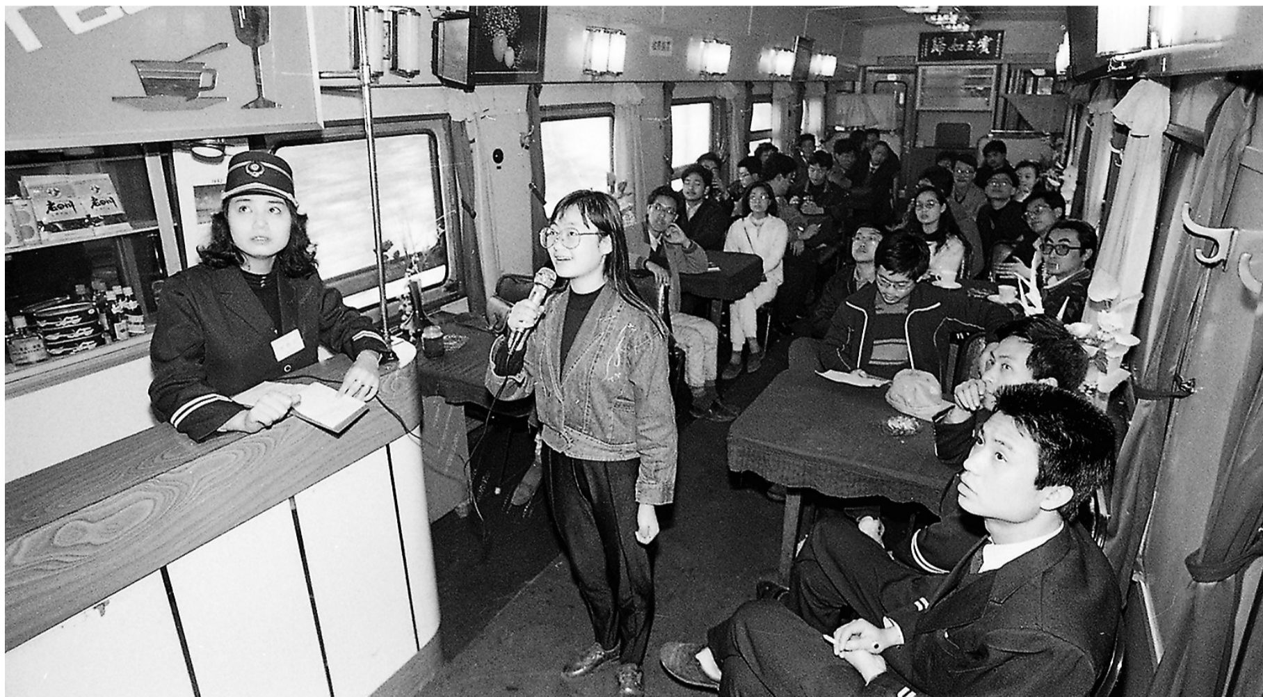
◀上世纪九十年代成渝铁路线上，重庆客运段餐车上的“卡拉OK”活动为旅客带来欢乐。

“对比一下就知道，在我的照片里，拥挤的站台变得井然有序，破旧的绿皮车变成了充满科技感的复兴号动车，农民工手中的化肥袋变成了滚轮旅行箱……一切都在变化。”曹宁说。