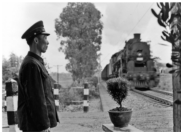
▲1982年11月，成都工务段道口工在成渝铁路九公道口值班，迎送通过的列车。