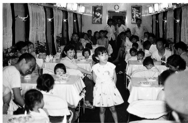
▲1984年6月1日，重庆至北京9/10次列车重庆客运段京快列车乘务员给小朋友过六一儿童节。