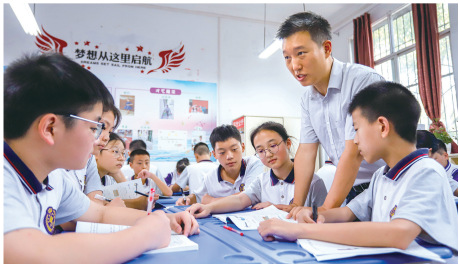
老师对小组合作学习中遇到的问题进行答疑解惑

基于此,巴南区统筹作业布置管理,开展“作业设计”评比活动,组织“作业设计”课题研究,已申报课题20多个,开设文体、艺术等精品课程项目60余个,课后服务覆盖率100%,参与率达99%以上,教师们多次获得市级赛课一等奖,参加全国第14届运动会获得足球项目冠军,骨干教师、学科带头人、特级教师、学科名师队伍进一步完备,巴南优秀教师队伍示范力在逐步扩大。