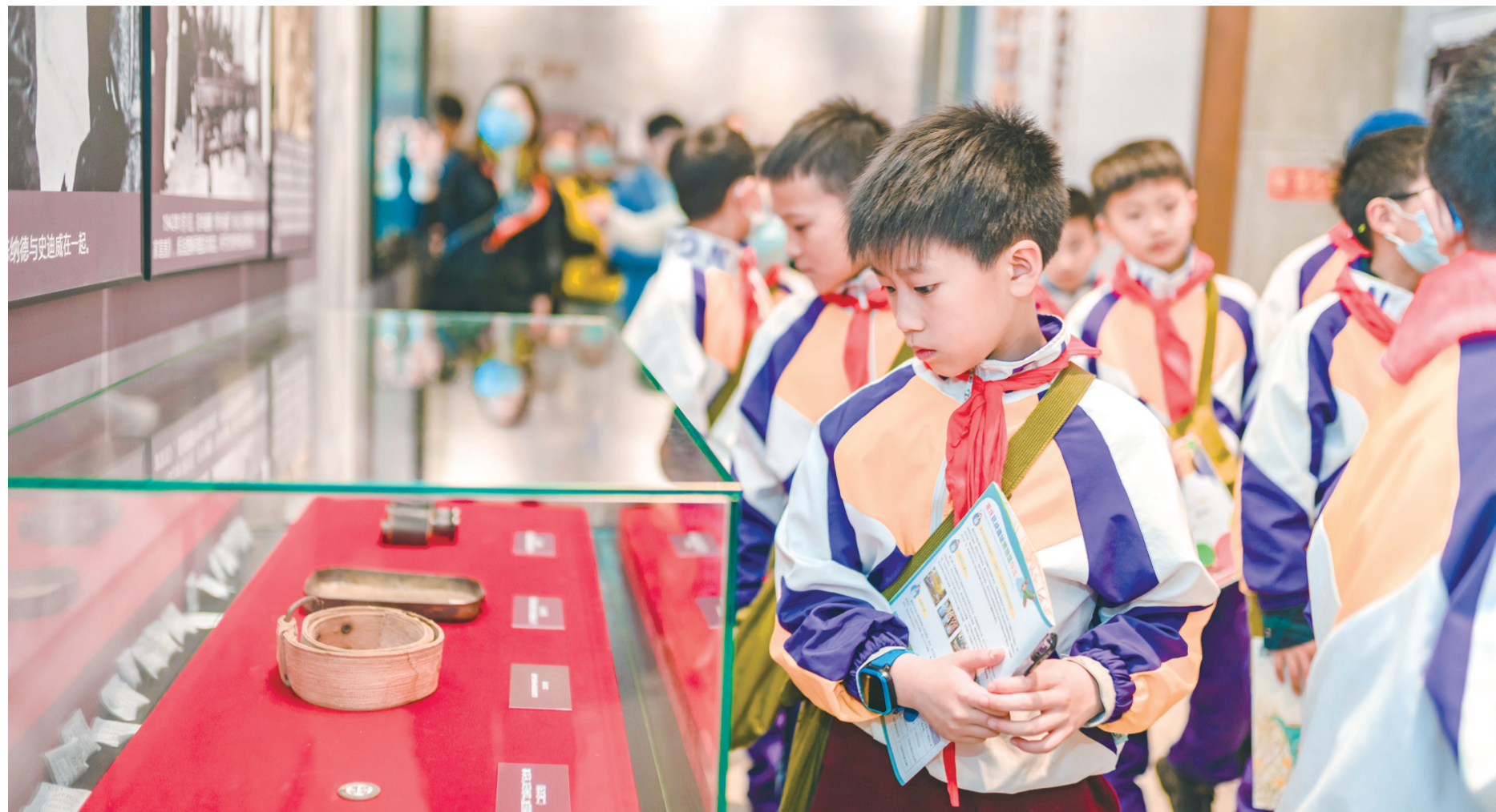
学生们到红色基地接受红色文化熏陶

教育既是关乎国家富强民族复兴的大事,又是关系民生福祉的要事。近年来,巴南区以建成“教育强区”为目标,点燃党建引擎,驱动全区教育实现高质量发展,为巴南推进高质量发展、创造高品质生活提供强有力的智力支持和人才支撑。