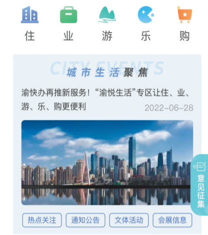
“渝快办”推出“渝悦生活”服务专区。(手机截屏)