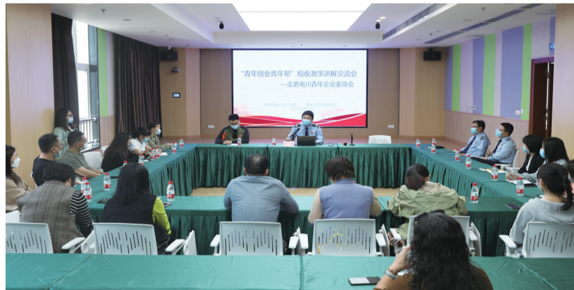
南川区税务局开展“青年创业青年帮”税收政策讲解交流会

在推动政银企对接方面，坚持线上线下同步推进的融资对接交流机制，今年共计为3716家中小微企业放款25.4亿元。