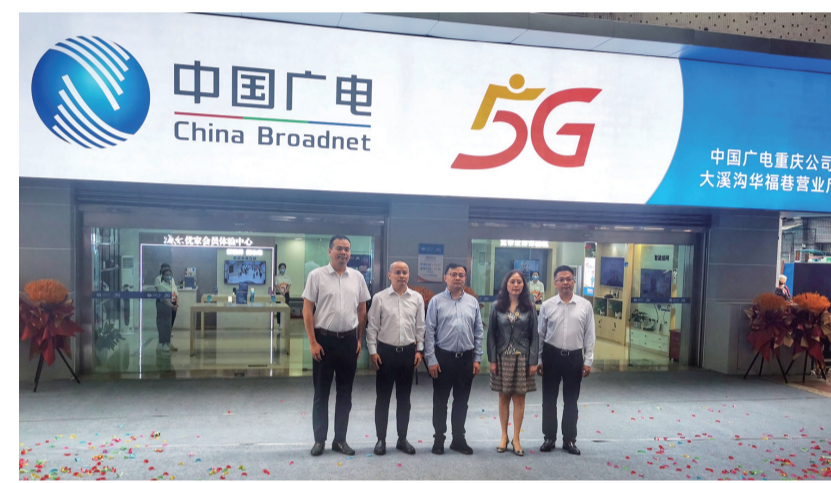
中国广电重庆公司华福巷营业厅焕新揭幕

的基础网络,积极开发5G、物联网、人工智能等新技术,初步构建并投用了以智慧安防、智慧家庭、数字小区为一体的“智慧广电+”生态。