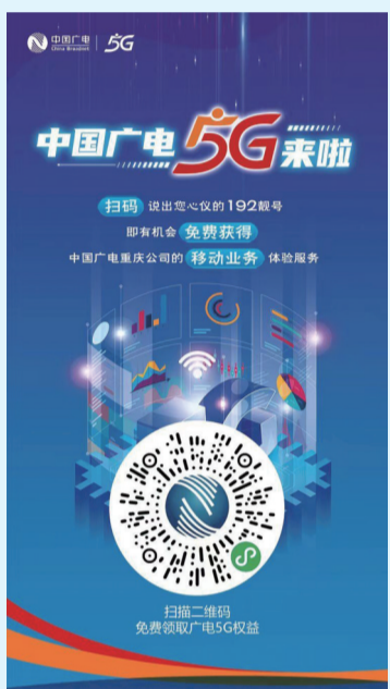
全市意向用户问卷调查活动开启