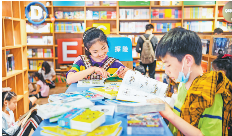
重庆书城，孩子们正沉浸在图书的海洋里。

书店的场景已证明了这种变化。5月30日，记者在解放碑重庆书城六楼少儿专区看到，电梯口第一个荐书展台便是“科普百科”主题：《恐龙简史》《自然之美》《植物大家庭》……数十种科普读物题材多元，琳琅满目，比前几年增加了不少。工作人员告诉记者，一到节假日，少儿专区就围满了孩子，甚至地上都坐了一圈小读者。