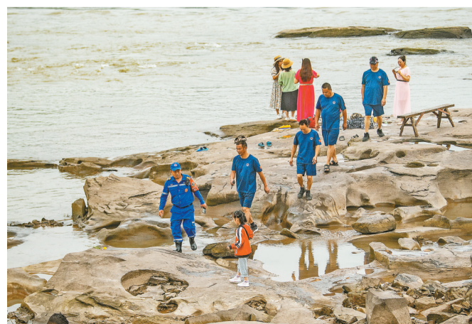
▲5月21日,大渡口区滑石滩长江边,值班队员们正在巡逻。