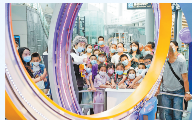
▲6月1日,重庆科技馆推出“科学时光机”儿童节专题活动,科技辅导员扮演科学家跟孩子们近距离互动。