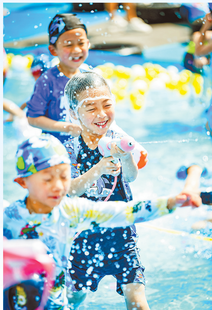
▲5月31日,两江新区湖畔幼儿园上演了“水枪大战”,小朋友们身穿泳衣,手持水枪玩具快乐玩水,欢度“六一”儿童节。