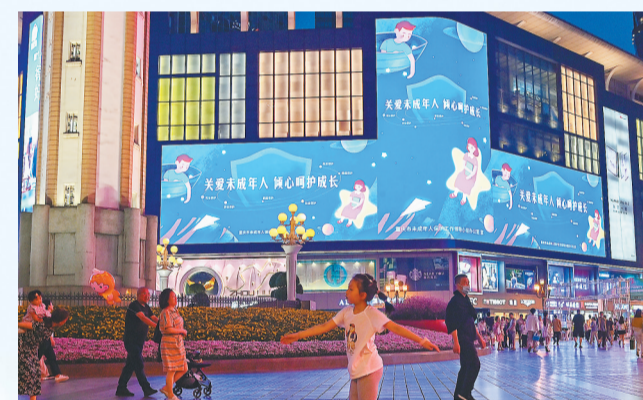
▲6月1日,渝中区解放碑商圈,LED屏幕为儿童节“亮灯”,将美好祝福送给全市少年儿童。