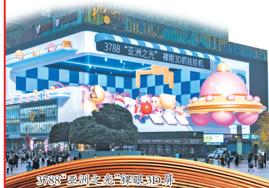
3788“亚洲之光”裸眼3D眼镜

这背后是观音桥商圈紧紧围绕江北区“12345”总体发展思路,聚焦国际消费中心城市首选区目标加快建设,全力打造世界知名商圈的决心与努力。集都市旅游、新场景消费、活动体验等于一体的观音桥商圈,正成为国际消费中心城市核心窗口。