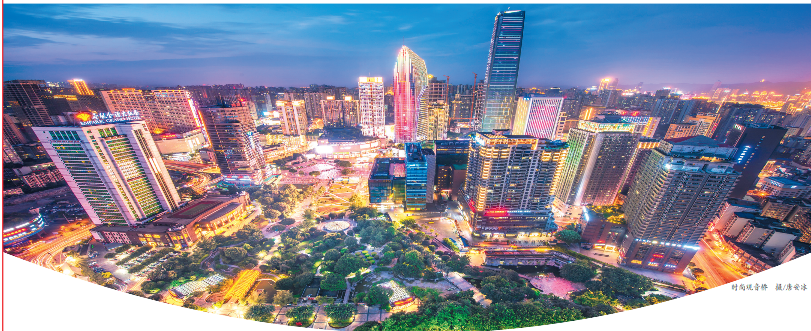
时尚观音桥