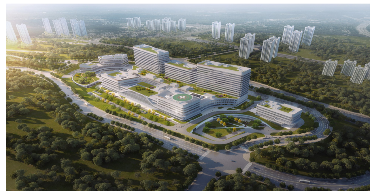
九龙坡区人民医院迁建工程

人才兴则医院兴,学科强则医院强。医院加大高层次人才引进力度和人才培养深度。近5年来,九龙坡区人民医院成功引进高层次人才40名,新增重庆市区县医疗卫生学术技术带头人3名、重庆市区县医学头雁人才2名。同时选送10多名优秀的医疗技