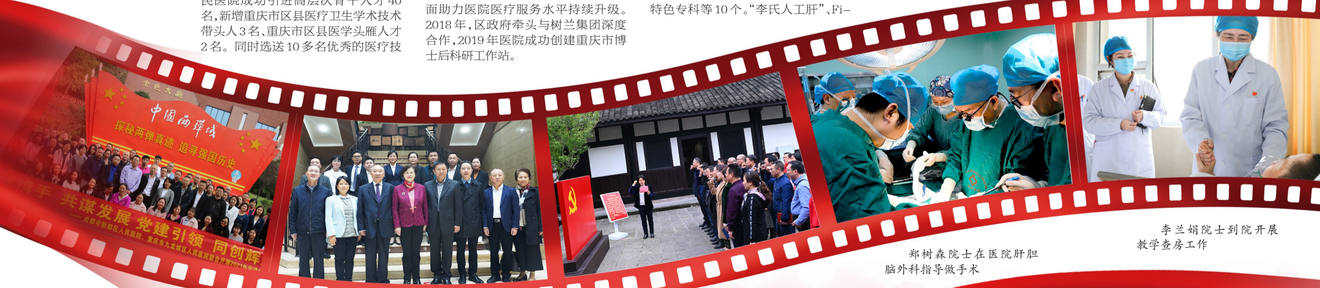
李兰娟院士到院开展教学查房工作