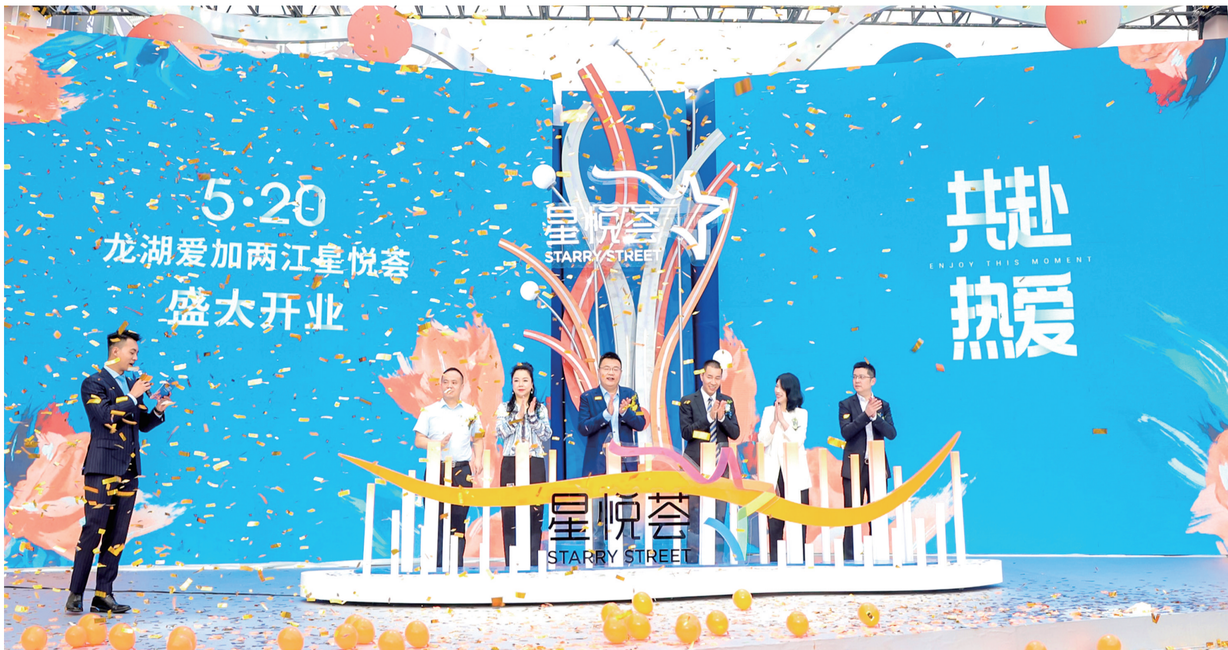
龙湖爱加两江星悦荟开业现场