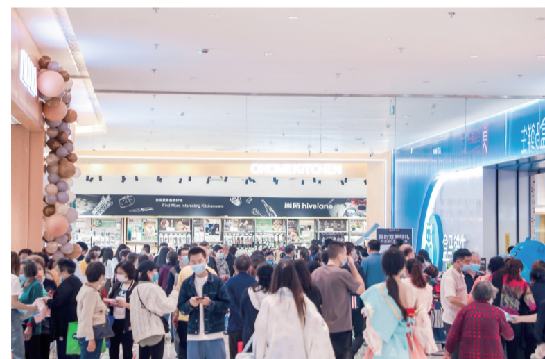
龙湖重庆爱加两江星悦荟开业现场

餐饮方面，汇聚了雲川菜、顺祺佛爷煲、飞麦披萨、山味客山野菌汤、兰小官等数十个品牌餐饮，以及星巴克、奈雪等轻食饮品品牌；休闲娱乐方面，有海悦荟健身、隐这里、保利影院、魅KTV、Rend等一系列特色品牌加盟。此外，项目还汇聚了拾点托育、运动博士、福特、瓊洋齿科等众多亲子服务和生活服务品牌。