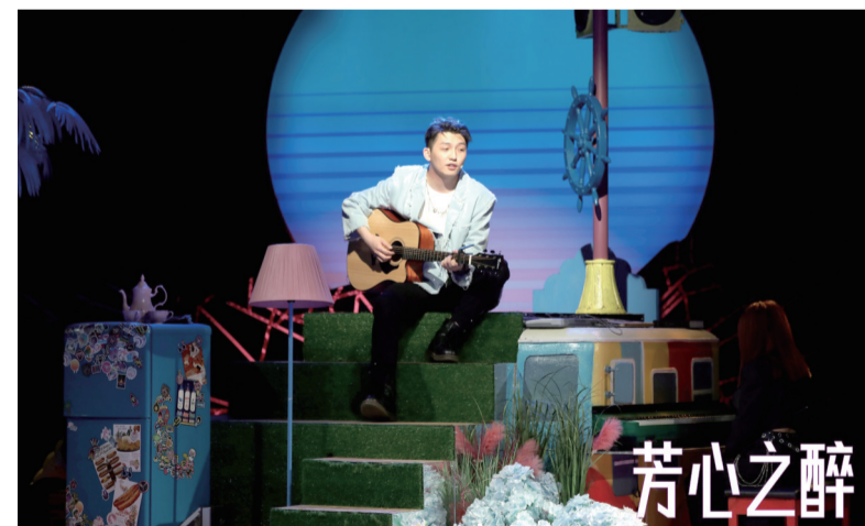
大型情景剧《芳心之醉》剧照

开业现场，15米“双生繁花”巨型艺术装置唯美绽放，7米高“巨型玫瑰”同期惊艳亮相，解锁“520”独一无二的仪式感，为重庆年轻消费者打造城市级浪漫。此外，零售全场5折起、千万珑珠补贴；20+精致大餐满200元送200元，10+网红轻餐买一送一；超值礼包限量发售等超大力度优惠活动，以及线上线下多元的叠加玩法，也给消费者带来重重惊喜。