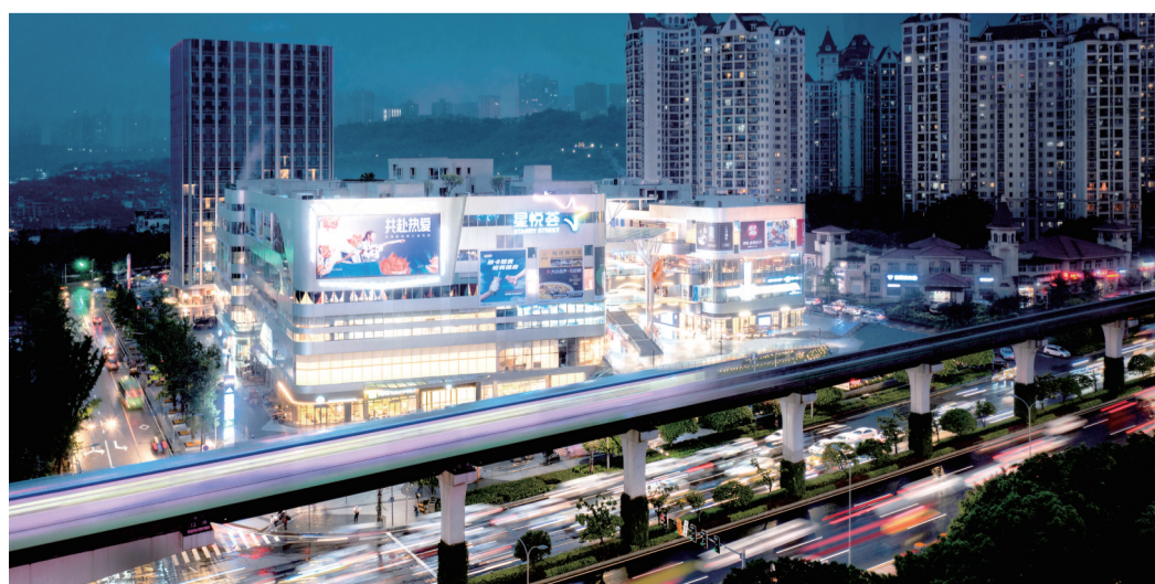
龙湖重庆爱加两江星悦荟

龙湖爱加两江星悦荟的开业，是龙湖商业2022年布局的重要一子，标志着龙湖在重庆主城区的网格化布局更进一步；而龙湖集团与宝田股份携手，也为轻资产商业项目探索提供了全新的思路。截至2022年5月，龙湖商业在重庆已开业8座天街、2座星悦荟、1座家悦荟项目。2022年下半年，龙湖重庆时代天街E馆、龙湖重庆高新天街也即将绽放开业。坐落于解放碑商圈的半岛天街，正在紧密筹备中，全新亮相后将助力打造解放碑一朝天门世界级商圈。