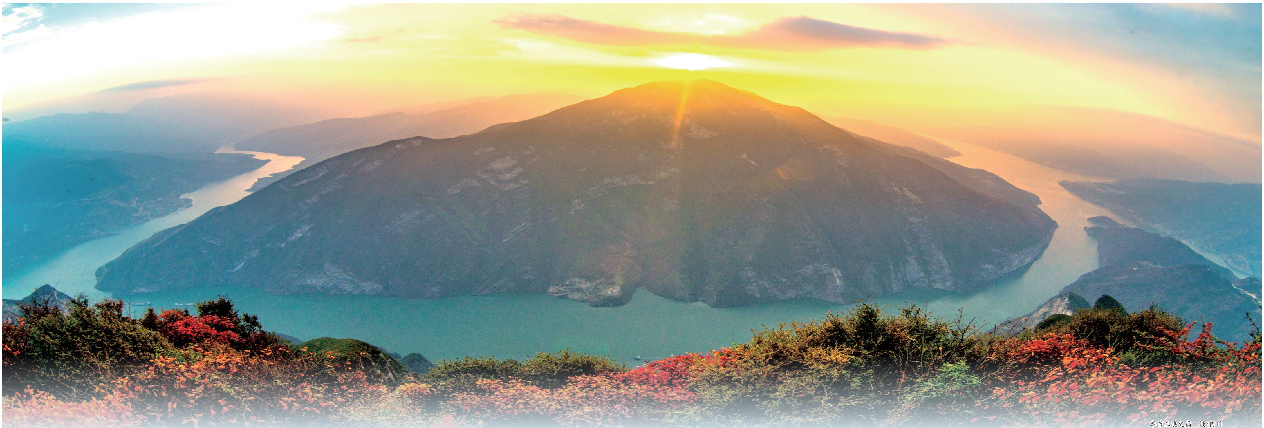
奉节三峡之夙