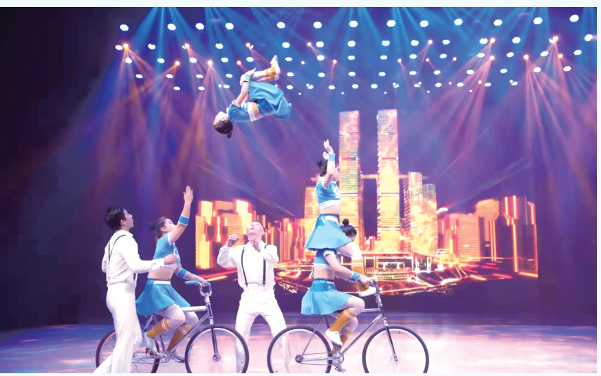
重庆市杂技团驻场演出《魔幻之都·极限快乐SHOW》