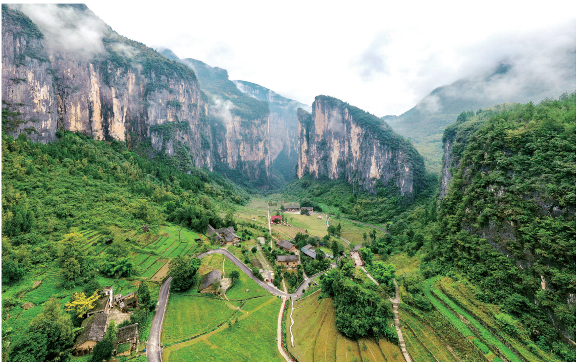
奉节三峡原乡

蓝图已经绘就，号角已经吹响。站在新起点，奉节正蓝起柚子加快推进文旅融合高质量发展，一个全新的奉节文旅“升级版”已经启航。